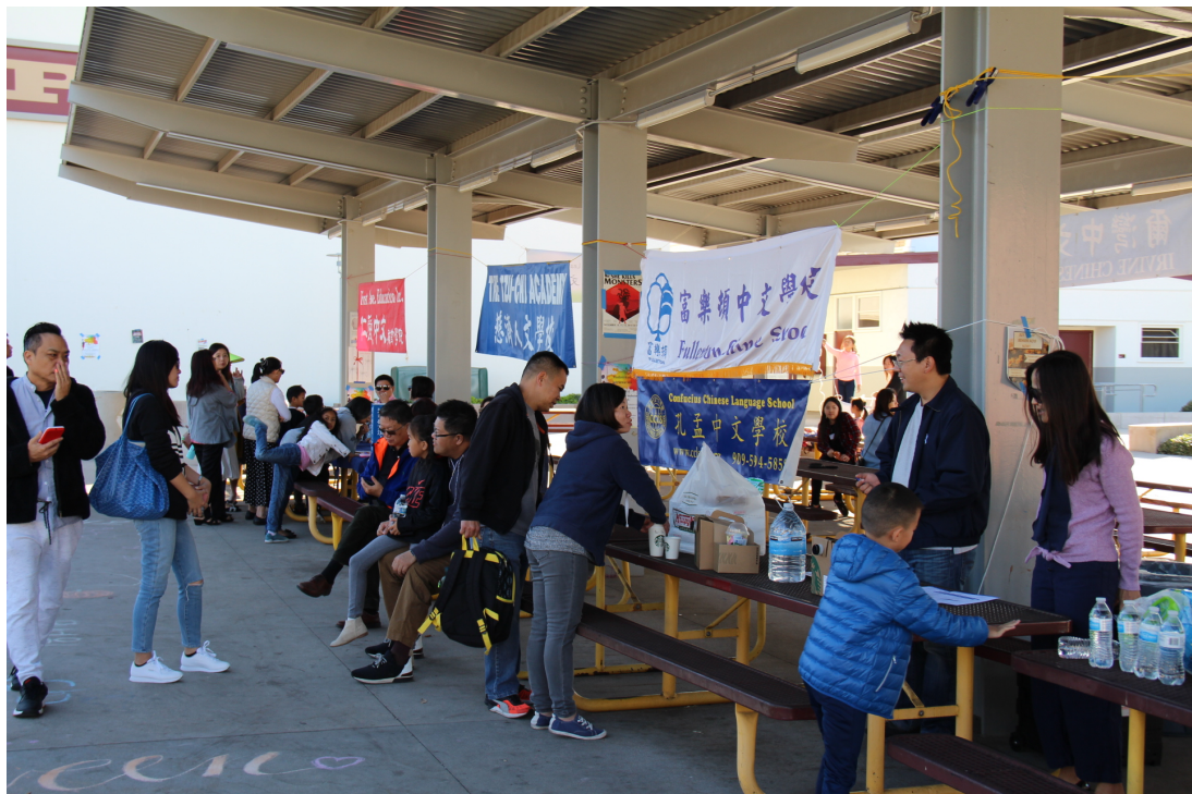
比賽當天各學校攤位一景

為了鼓勵學生們的踴躍參與，每位參賽者均發給「參加獎」獎狀，以資獎勵，各組參賽學生則以參賽總人數之30%為優勝而評選名次，並頒發獎盃，共201位中文學校及主流學校學生獲得授獎名次上台接受獎勵。