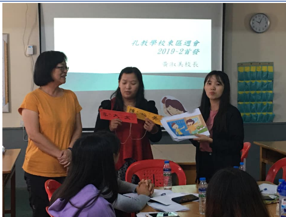
2019曼德勒孔教學校四校區初中部自然科與幼稚班教學研討會3