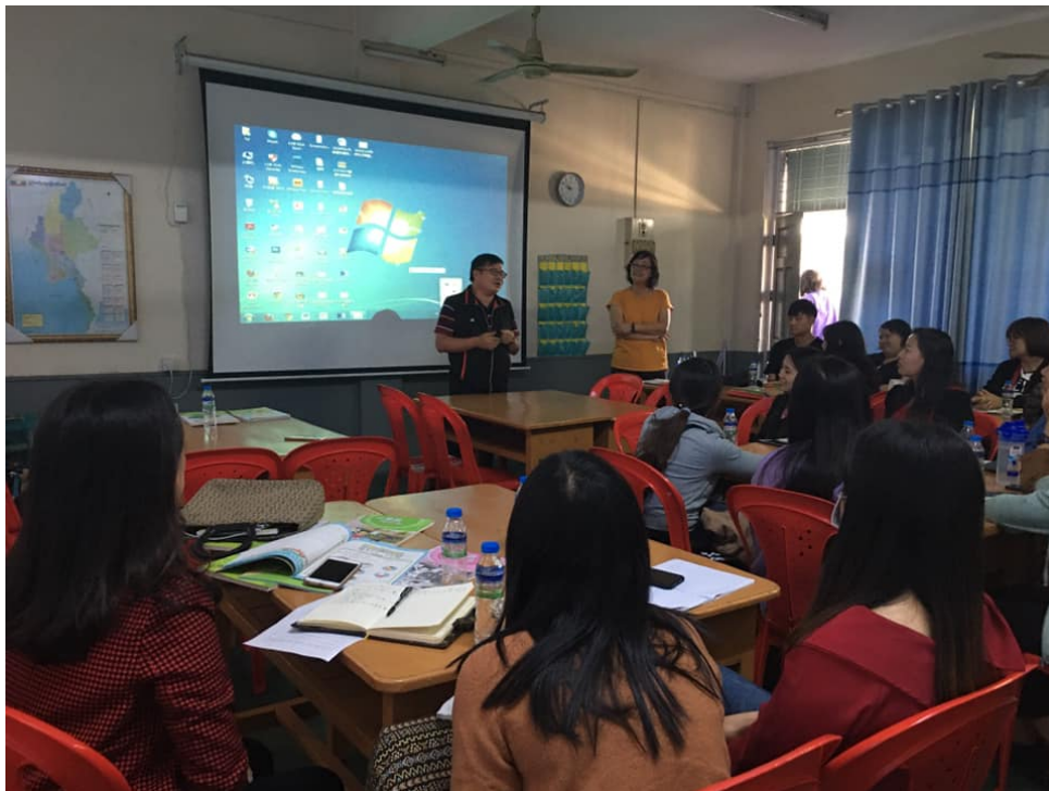
2019曼德勒孔教學校四校區初中部自然科與幼稚班教學研討會1

會議結束以後就分兩組，初中部自然科和幼兒園教學（國字、國音、數學科），再進行期末考的命題交流。經過此次研討，對於教師無論是教學方向，或未來的教學路上都大有幫助。