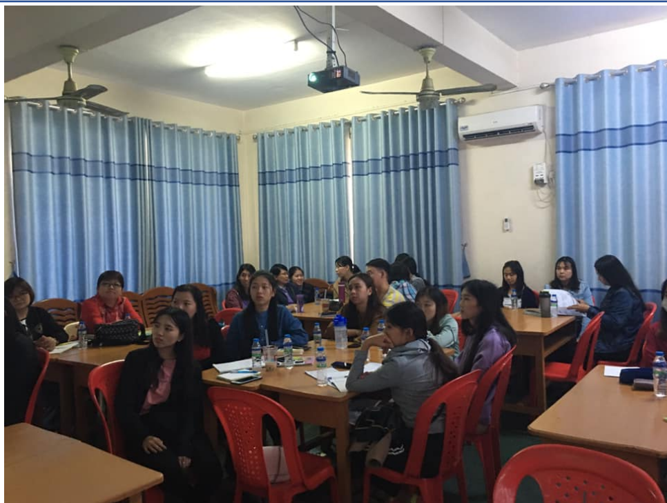
2019曼德勒孔教學校四校區初中部自然科與幼稚班教學研討會2