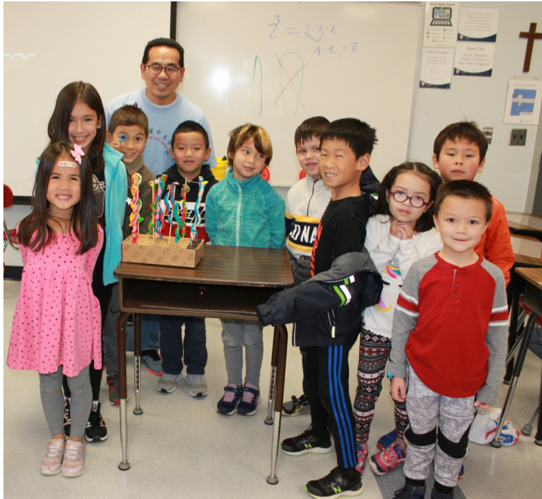
中年級同學做了精美又栩栩如生的捏麵人作品