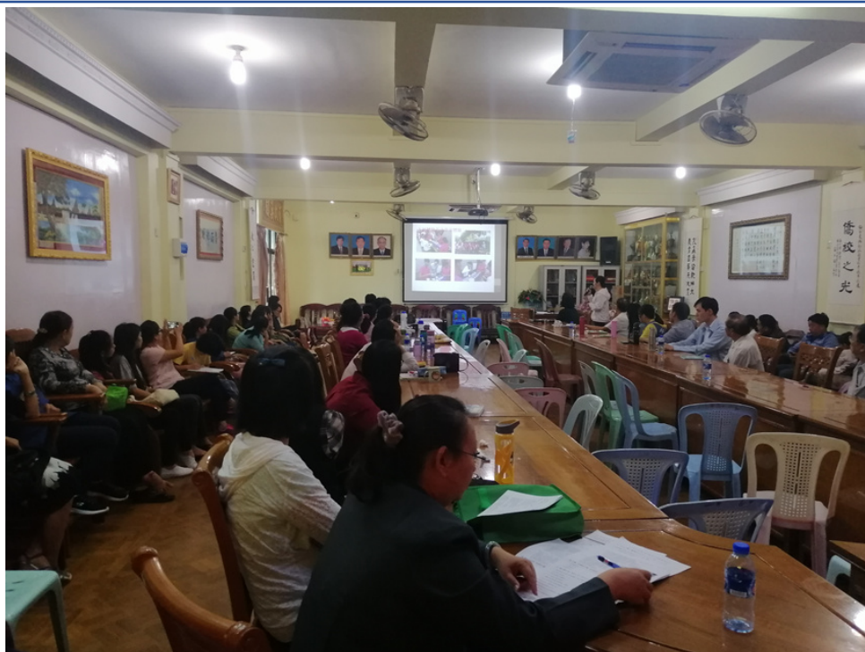
曼德勒孔教學校東區舉辦2019學年度下學期教師增能研習2