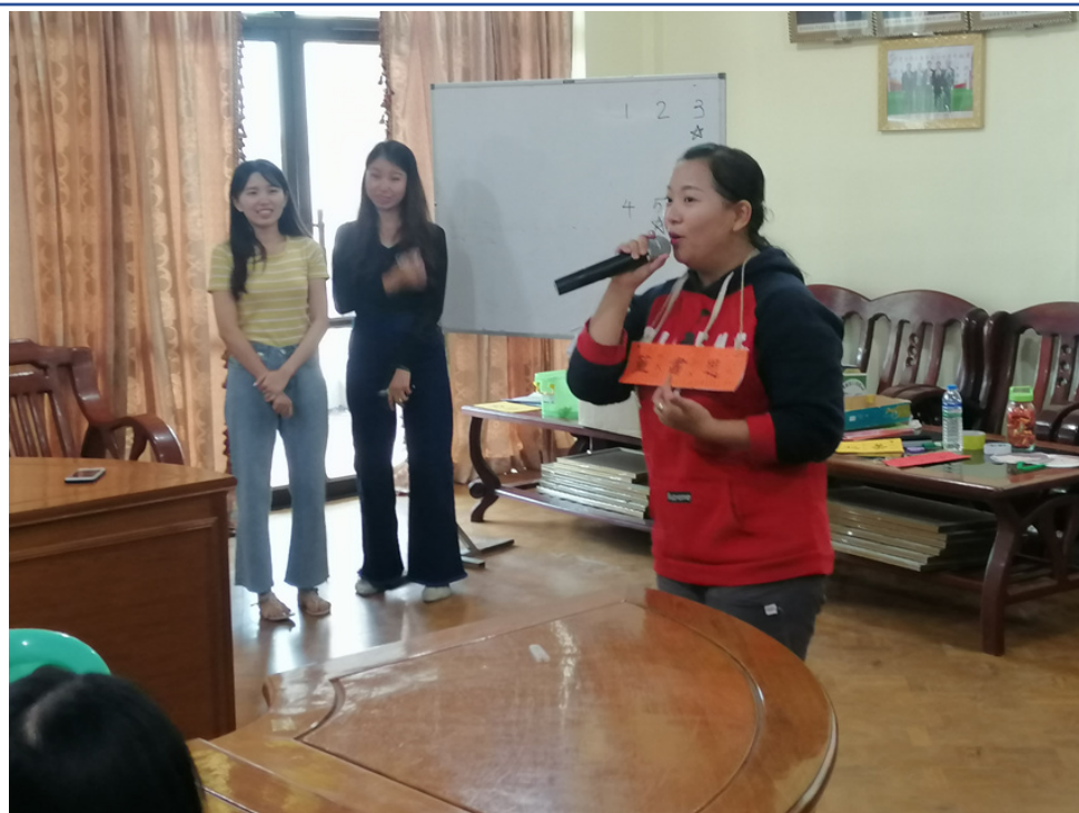
曼德勒孔教學校東區舉辦2019學年度下學期教師增能研習3