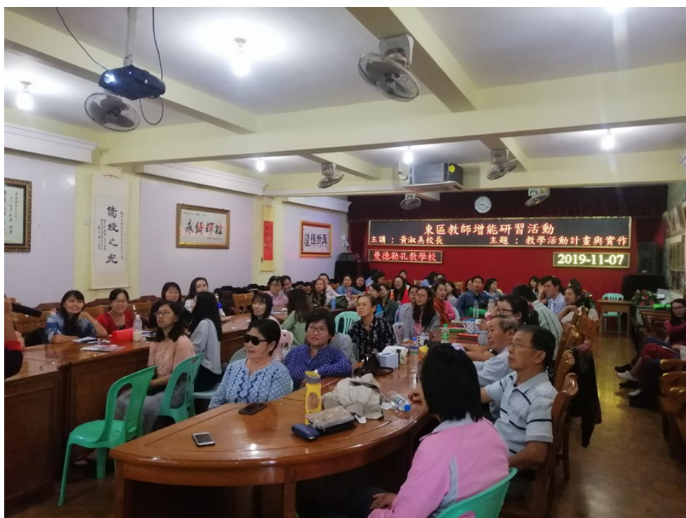
曼德勒孔教學校東區舉辦2019學年度下學期教師增能研習5