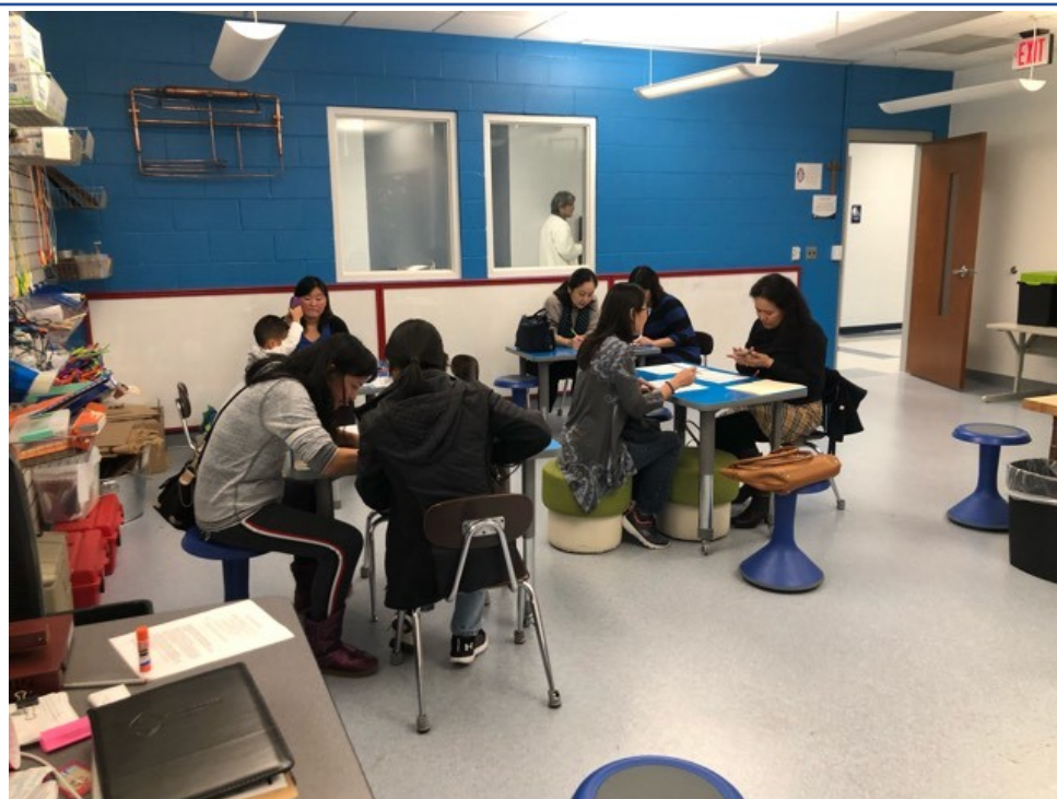
比賽前，裁判志工們討論比賽內容