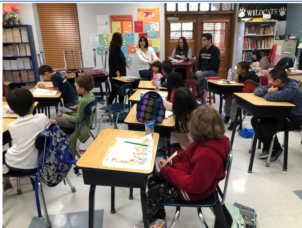
比賽過程老師與裁判們討論得分細節