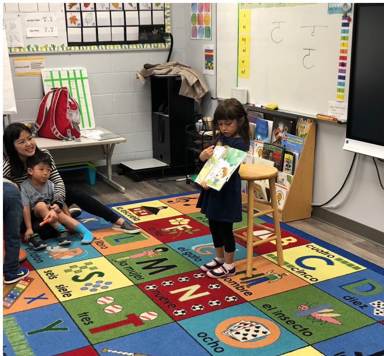
注音班孩子的說故事比賽，多位小孩為故事朗誦

藉由說故事比賽激勵學生更積極的學習說中文，並以中文表達故事的中心思想和自己的想法。學生們從緊張擔心到有自信的努力表達，體驗了刺激又充實的寶貴學習經驗。