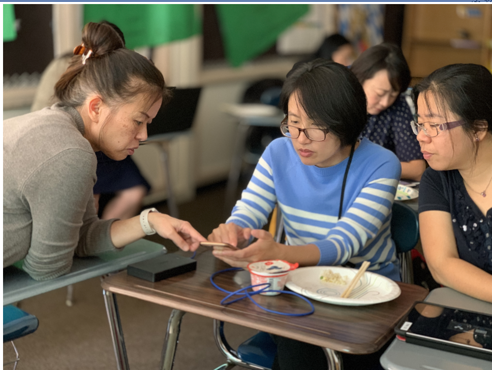
2019克里夫蘭數位教學示範點教師培訓—iMovie功能簡介以及如和利用Apple電腦或平板電腦來製作與編輯影片以輔助華語文數位教學2