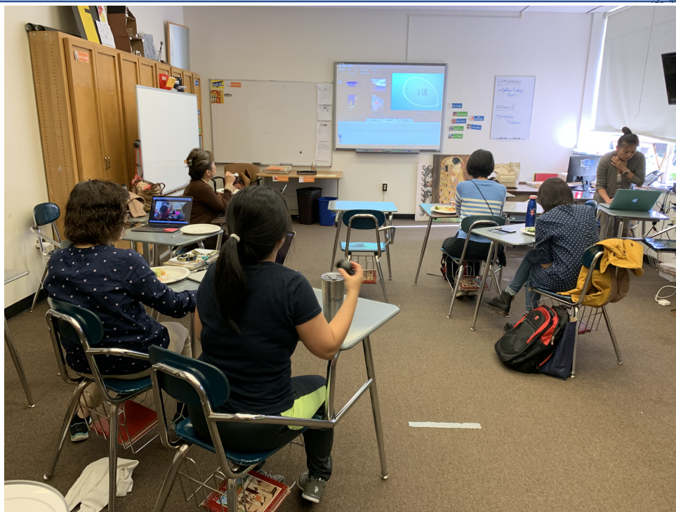
2019克里夫蘭數位教學示範點教師培訓—iMovie功能簡介以及如和利用Apple電腦或平板電腦來製作與剪輯影片以輔助華語文數位教學4