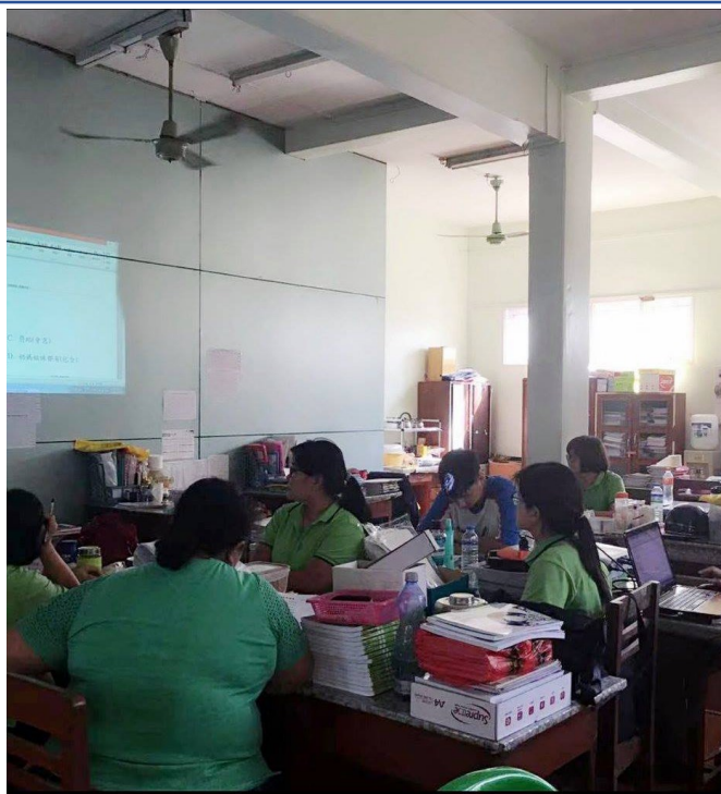
2019曼德勒孔教學校(北區)教師進修2