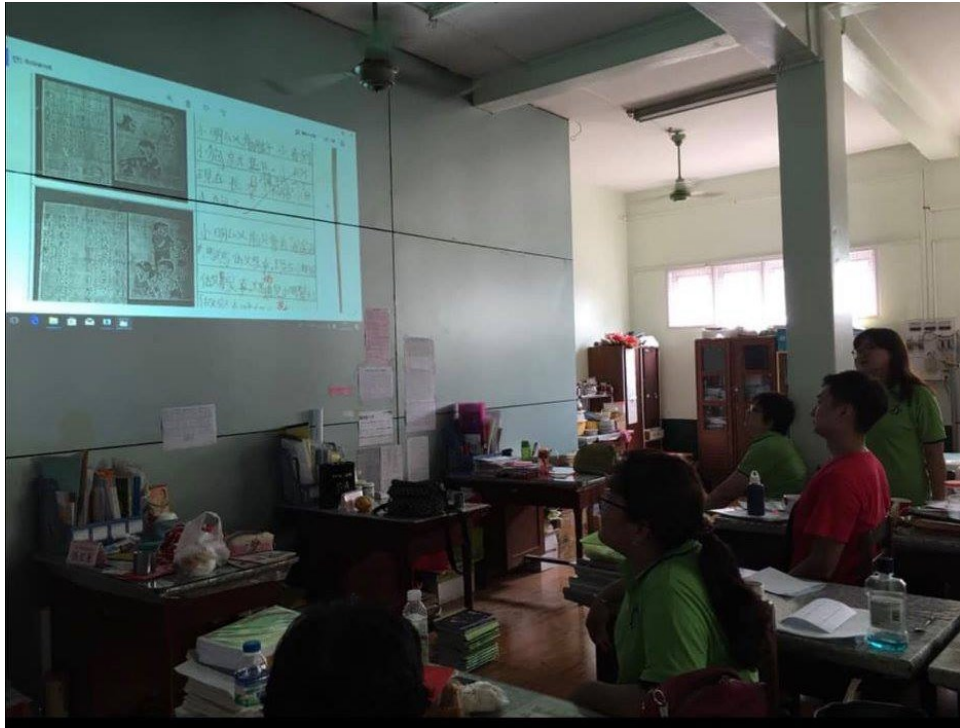
2019曼德勒孔教學校(北區)教師進修3