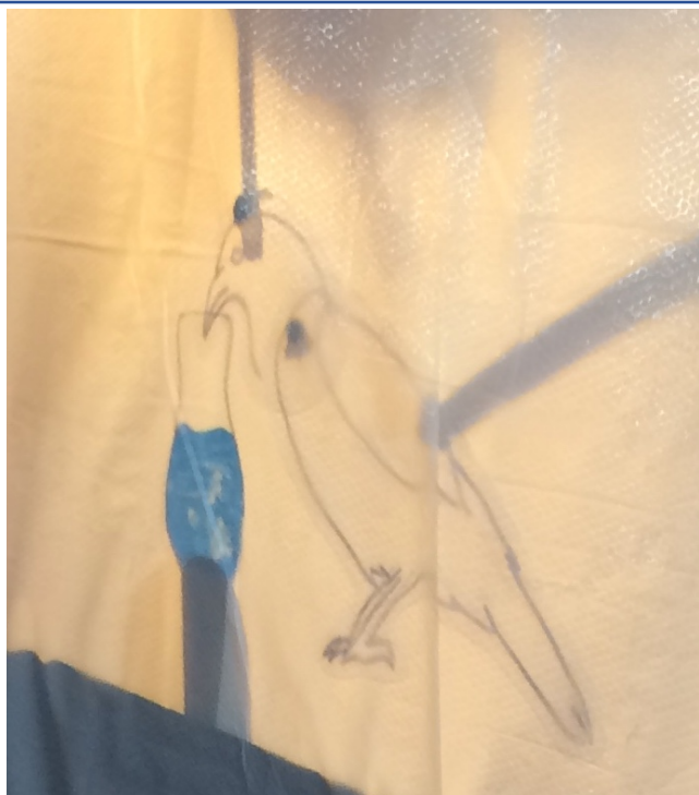
伊索寓言-烏鴉喝水