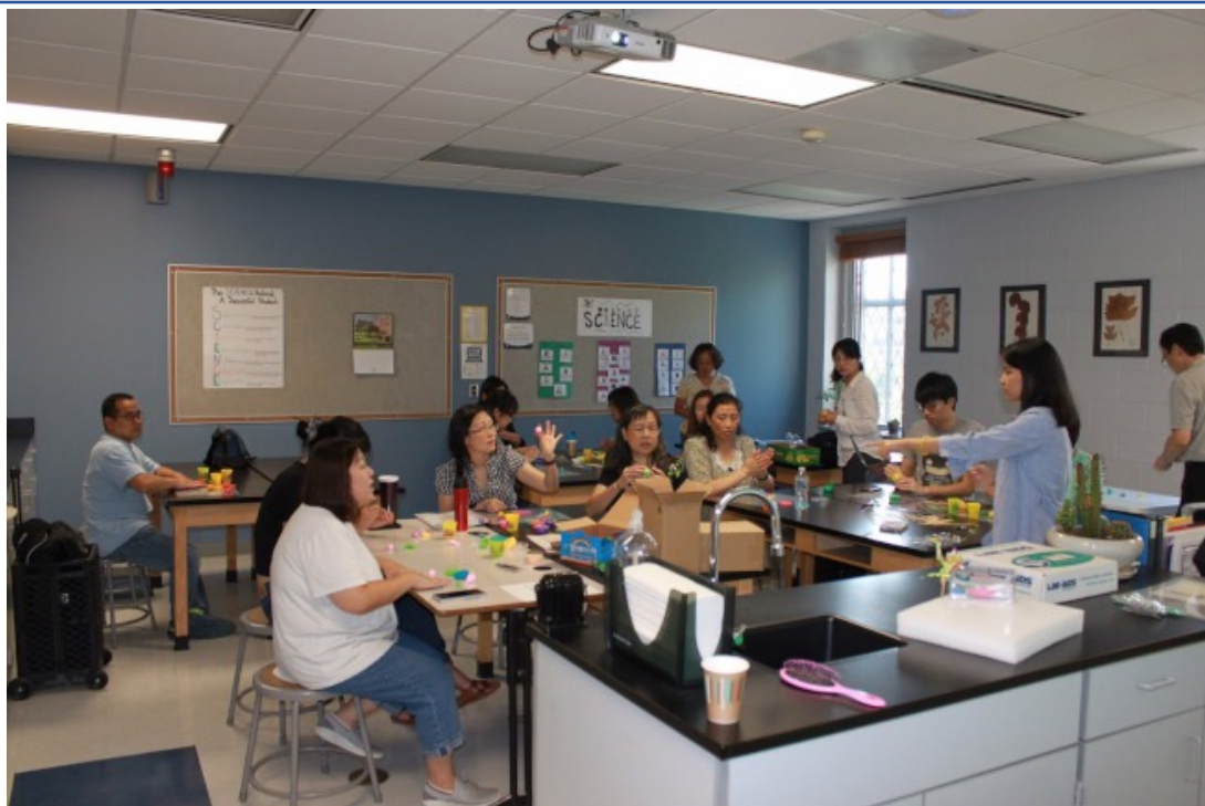
中文學校教師學習製作捏麵人