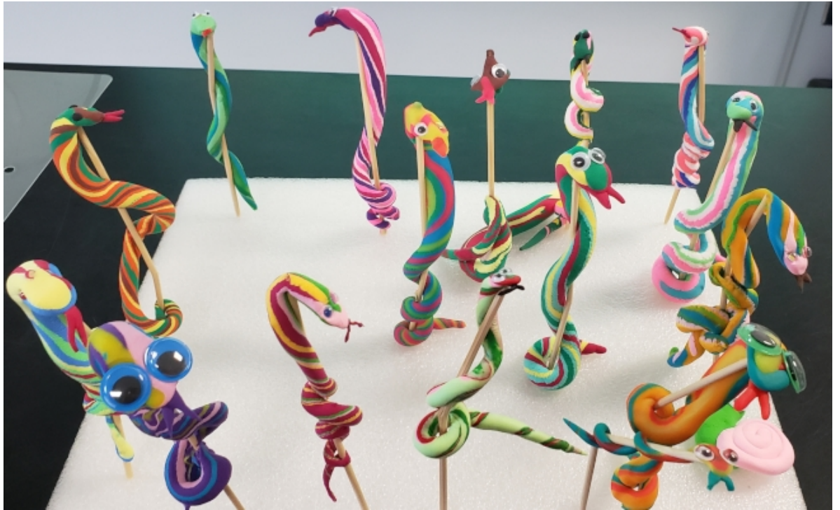
北卡洛麗中文學校中文教師的捏麵人作品