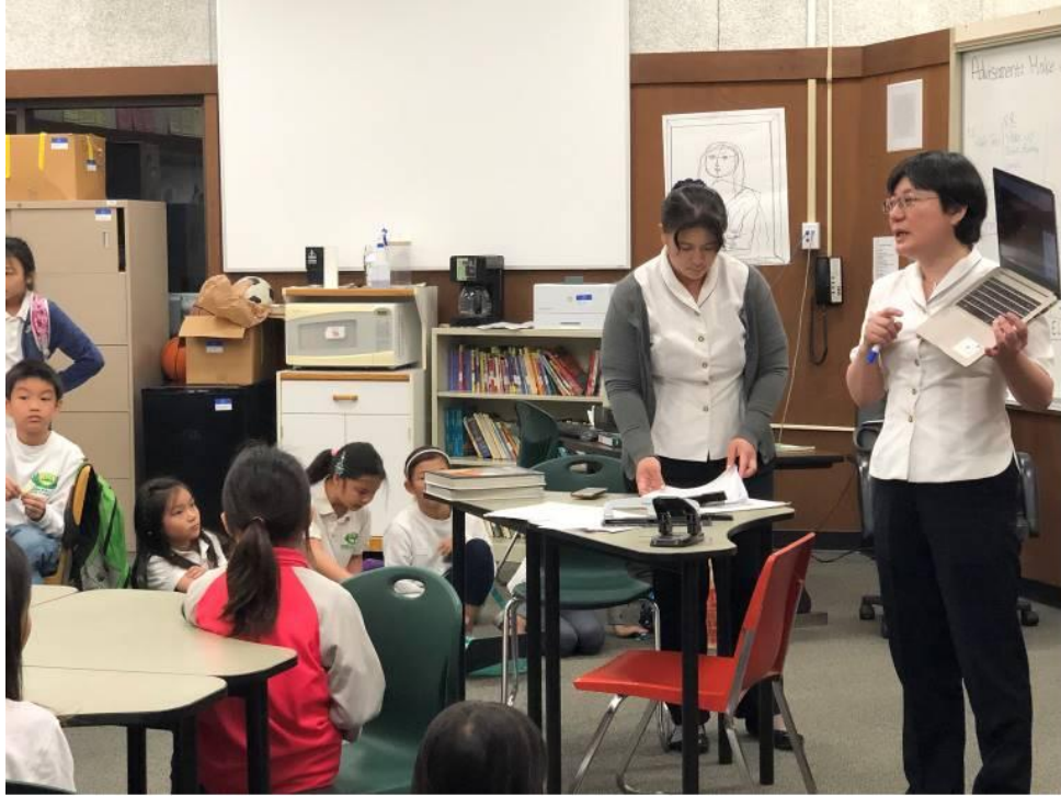
推廣海外正體漢字 加州爾灣慈濟人文學校辨識字比賽3