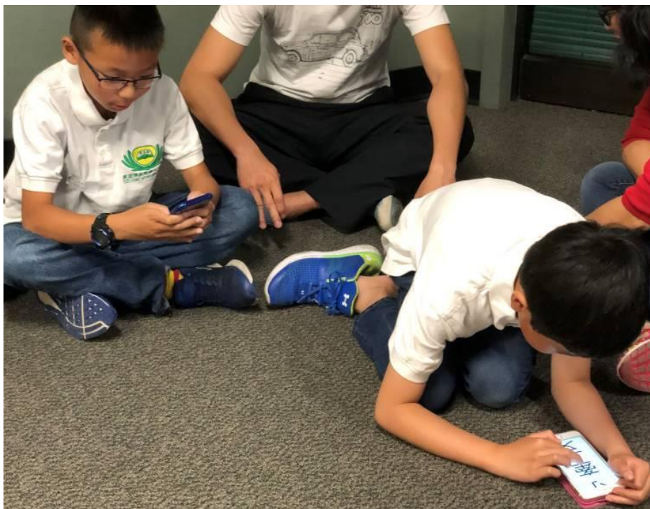
推廣海外正體漢字 加州爾灣慈濟人文學校辦識字比賽1

報名請洽：(949)916-4488 或tca.irvine@gmail.com