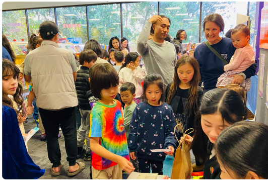
闖關後大家開開心心換禮物（上）非常開心拿到介紹臺灣的桌曆（下）