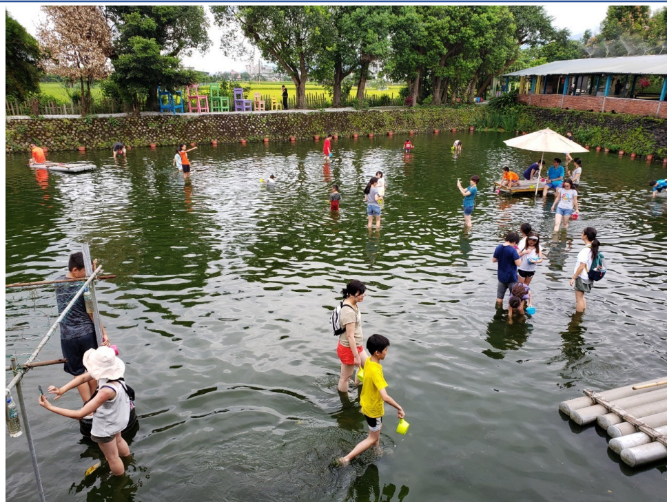
學員體驗台灣的農家樂-摸蜆