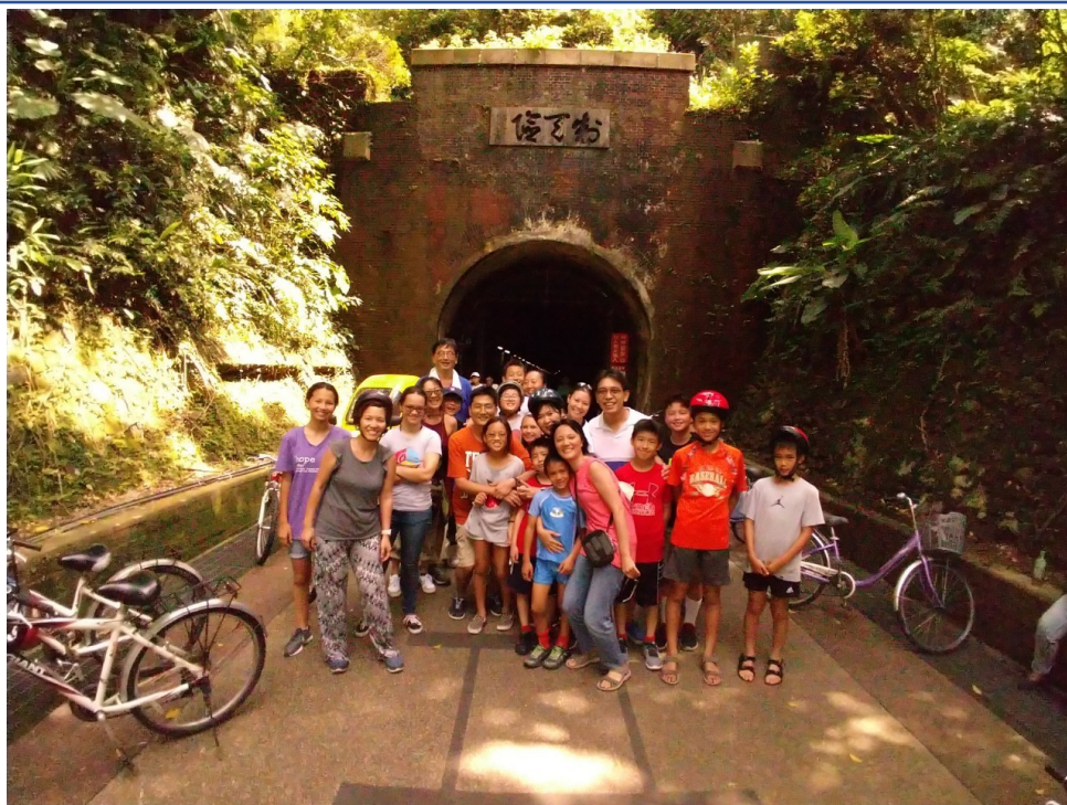
學員體驗台灣宜蘭著名的隧道自行車之旅