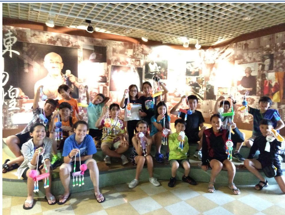
學員參訪台北偶戲館, 了解台灣偶戲歷史並動手DIY小狗戲偶