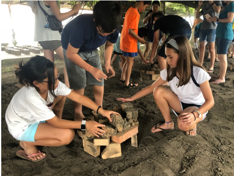
學員體驗台灣的農家樂-控窯