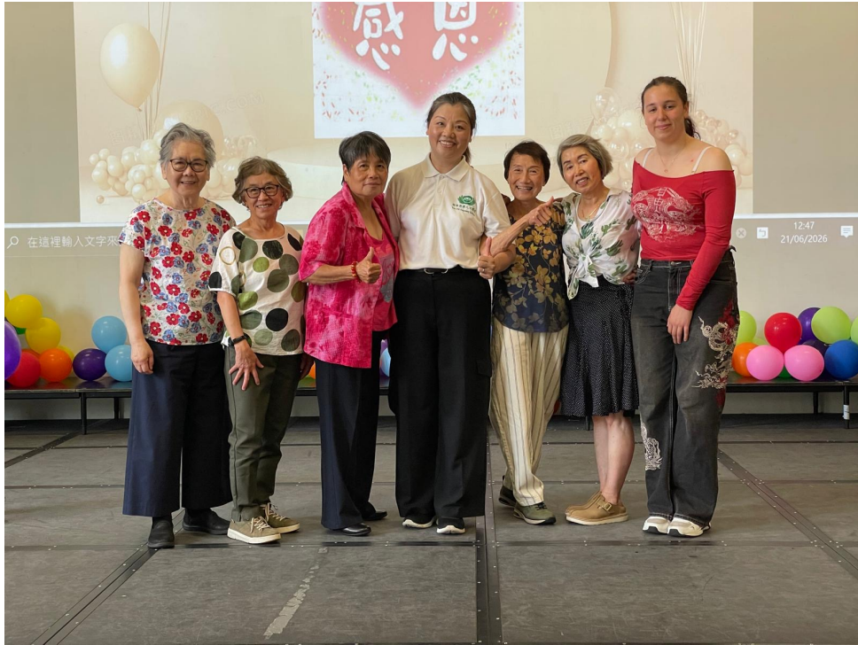
比賽結束後成人班學生與老師合影