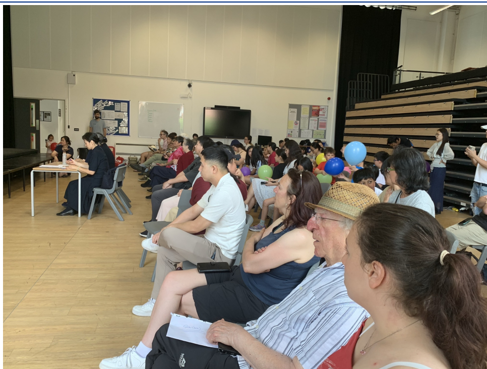
台下觀眾與評審們聚精會神聆聽學生演唱