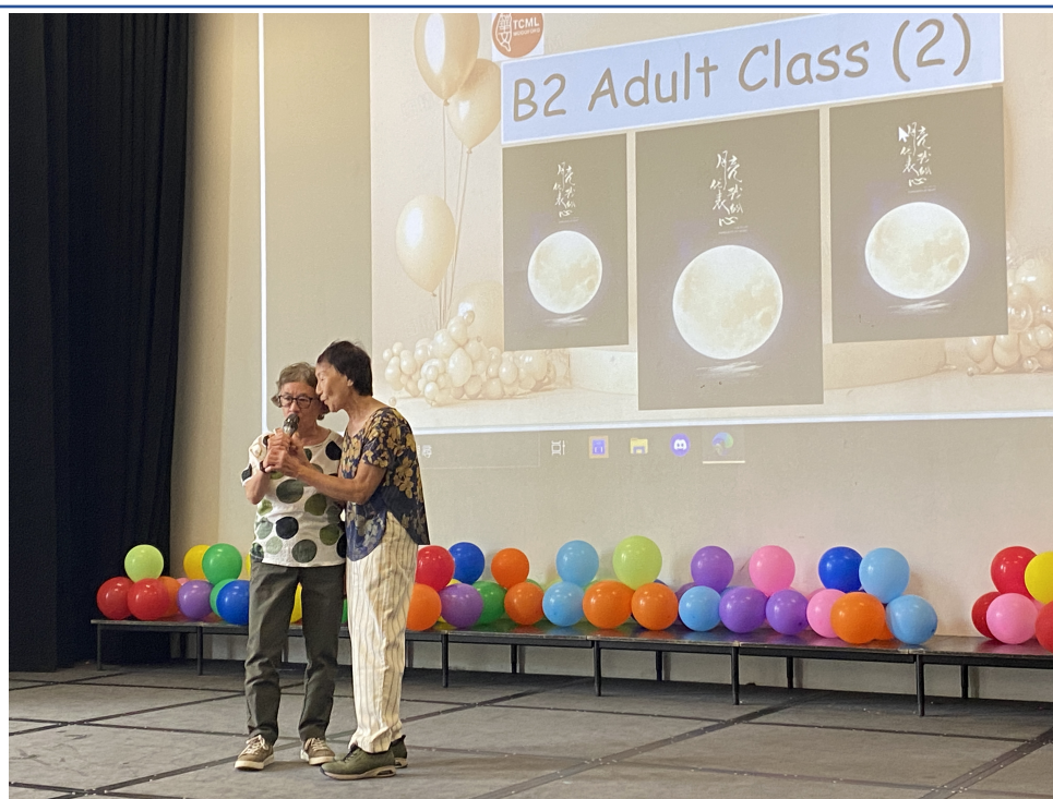
成人班學生雙人組男女對唱