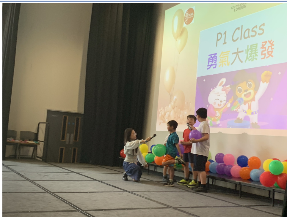
P1班小朋友在舞台上演唱