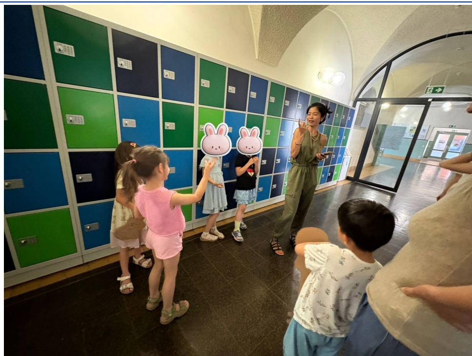
助教老師帶著第一組練習，一同共樂與學習。