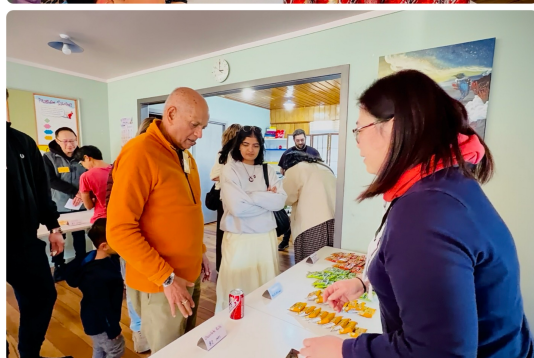
商品大多為臺灣食品（上）沙士（下）各種零食：方塊酥、捲心餅