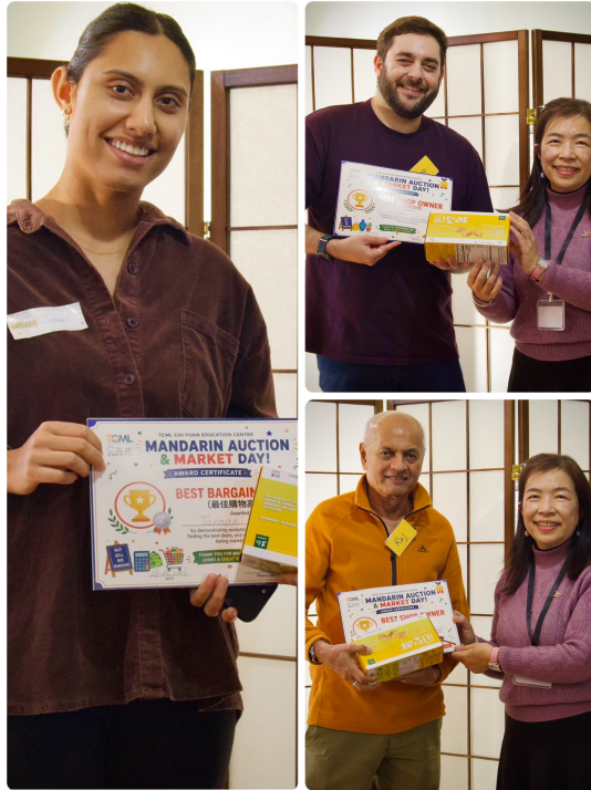
得獎者：最佳顧客獎（左）最佳老闆（右上）最佳拍賣官（右下）