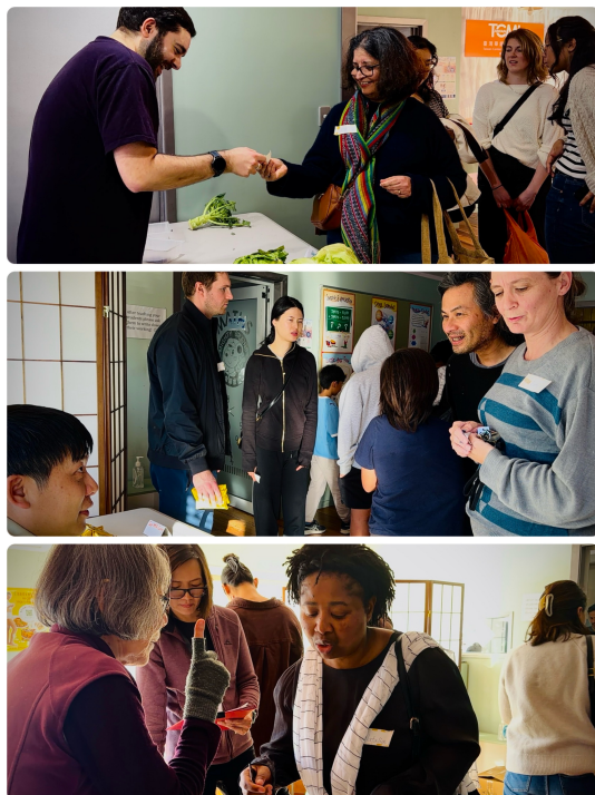
各商店由TCML學生們扮演老闆及顧客