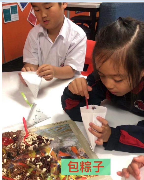
學生以五穀雜糧和小糖果體驗包粽子