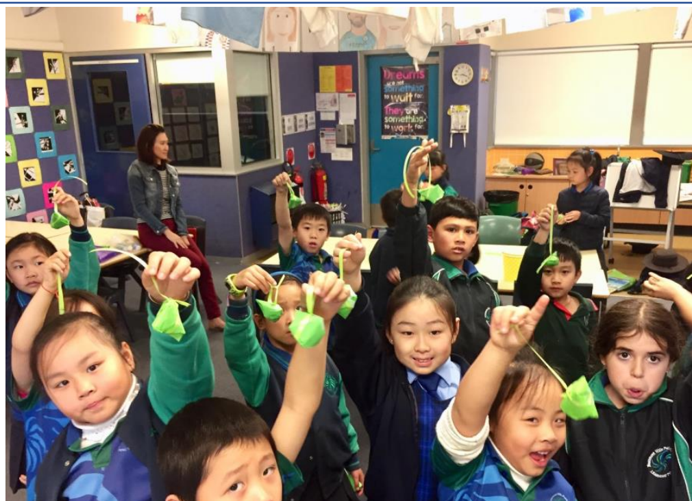
學生開心的展示完成的小粽子