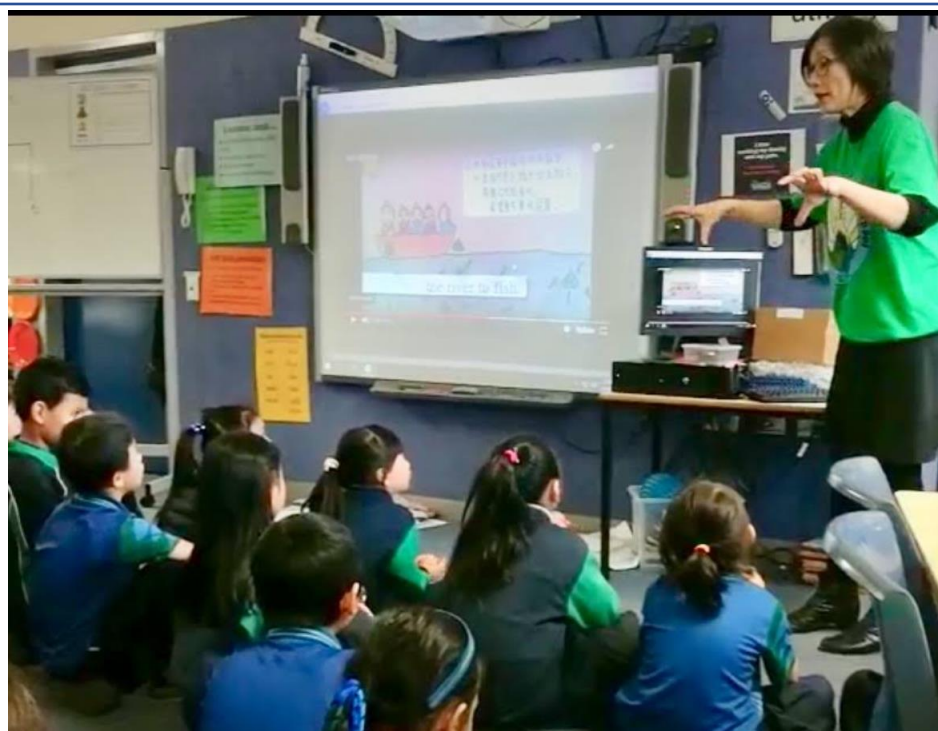
學生們津津有味地聽著龍舟比賽的由來