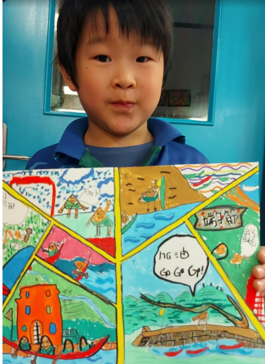
學生以漫畫方式理解端午傳說