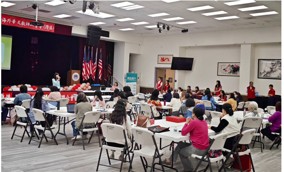
6月20日實體研習營會場