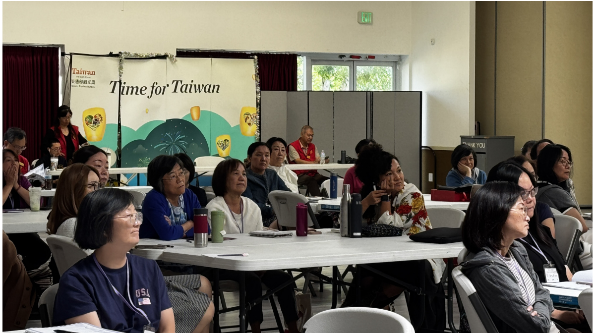
實體研習營－老師們聚精會神