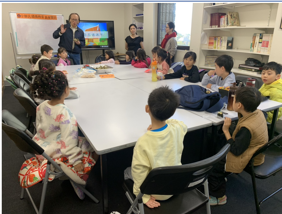
簡明輝校長致詞說明活動安排