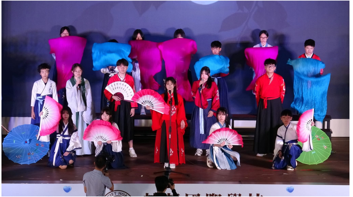
舞台表演與音樂 學生身著傳統漢服，表演舞蹈、朗誦與音樂演奏，展現中華文化的多元風采。