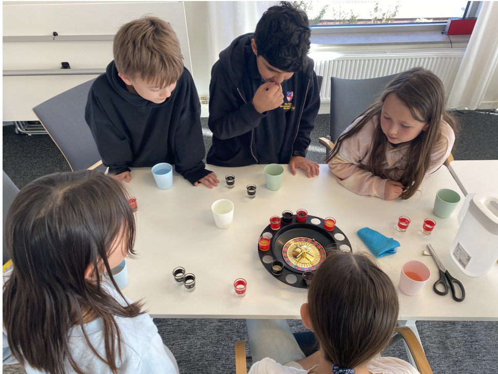
孩子們學習描述食物的味道