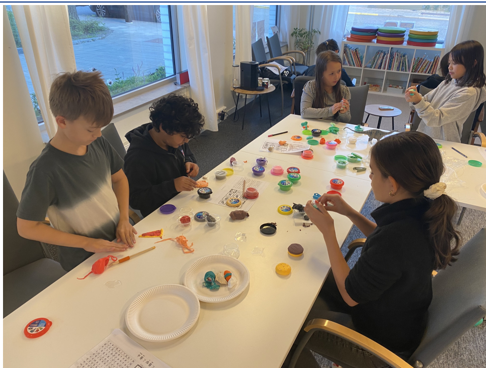
孩子們利用黏土製作食物，並學習食物的中文