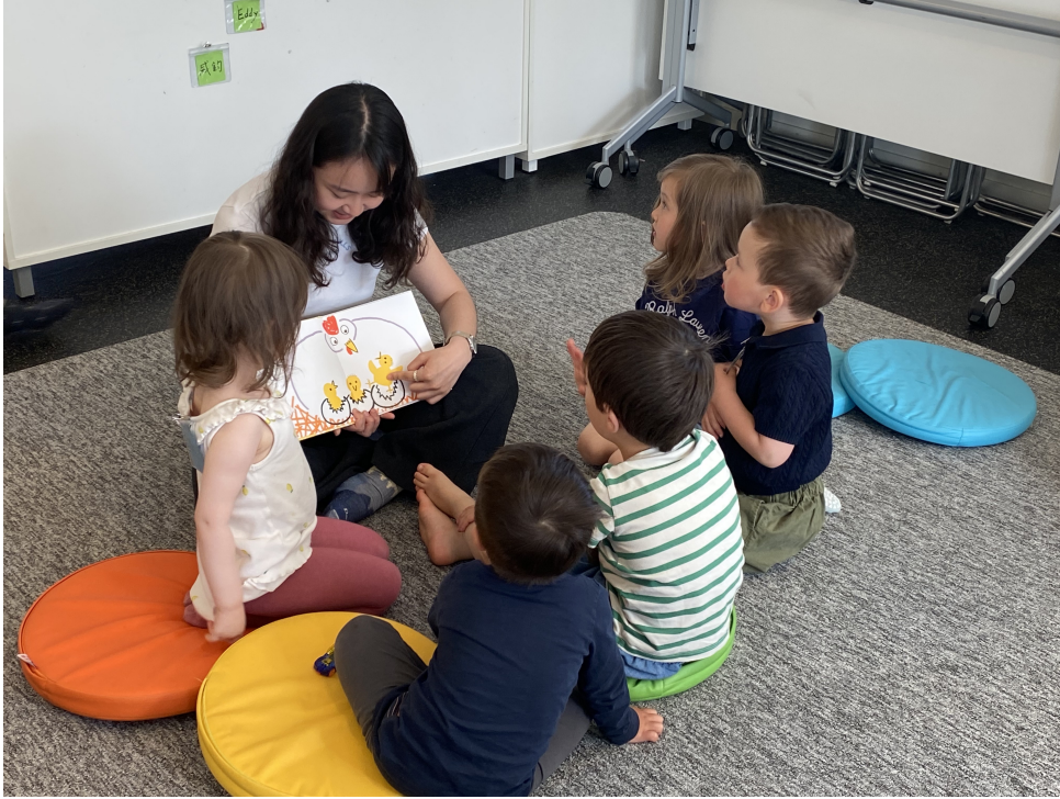
老師透過主題繪本引導幼兒學習中文