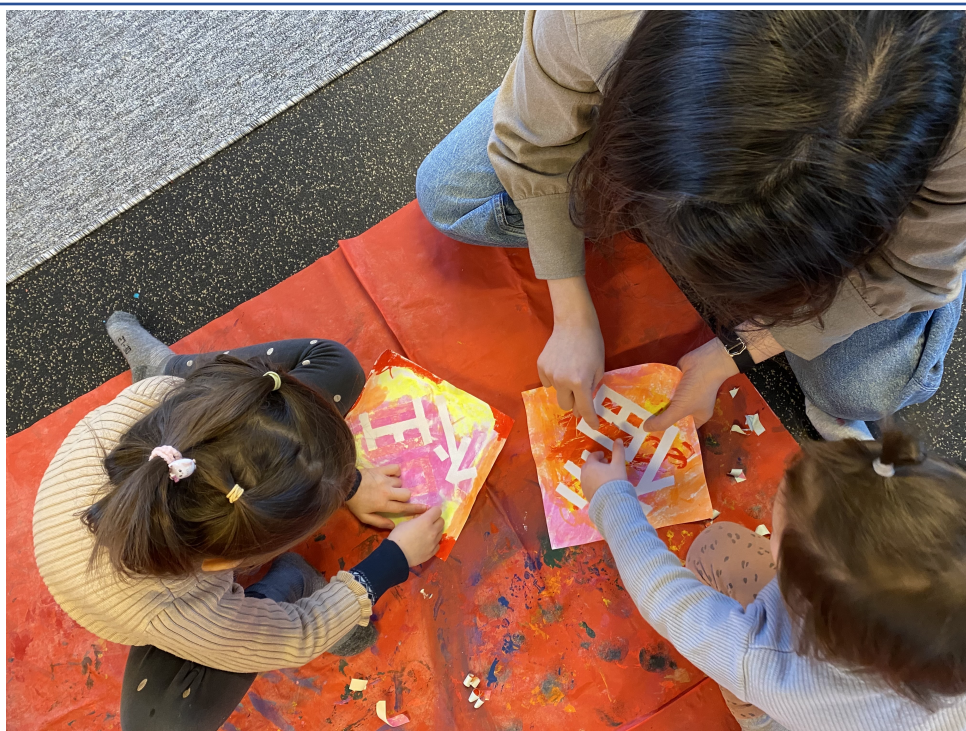
幼兒製作自己的春聯