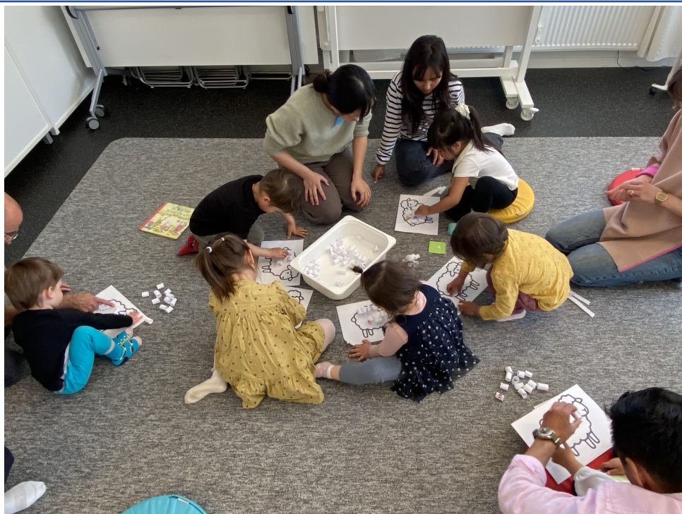
孩子進行剪羊毛活動