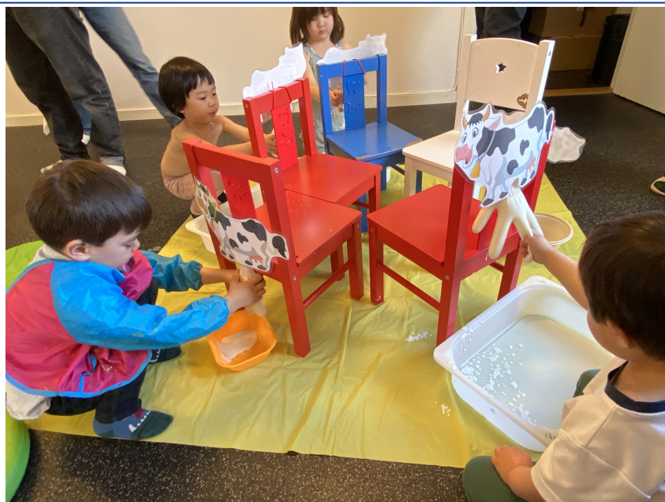
孩子學習擠牛奶活動