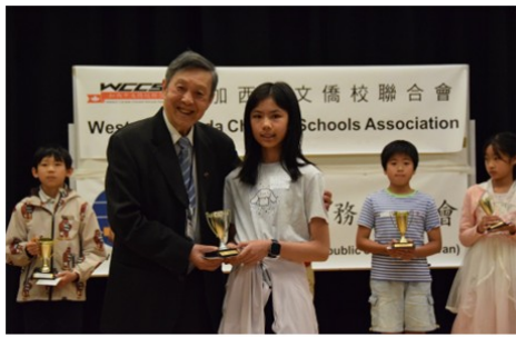
孩子們開心地捧著獎盃