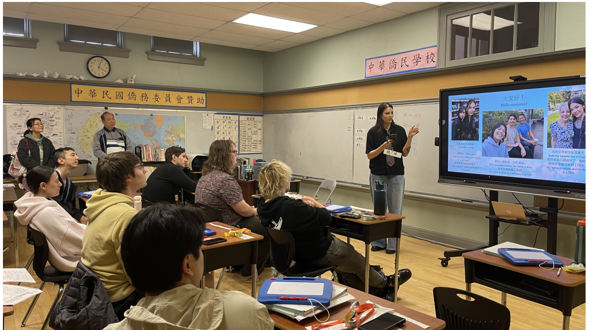
學生在結業典禮中的成果展 1