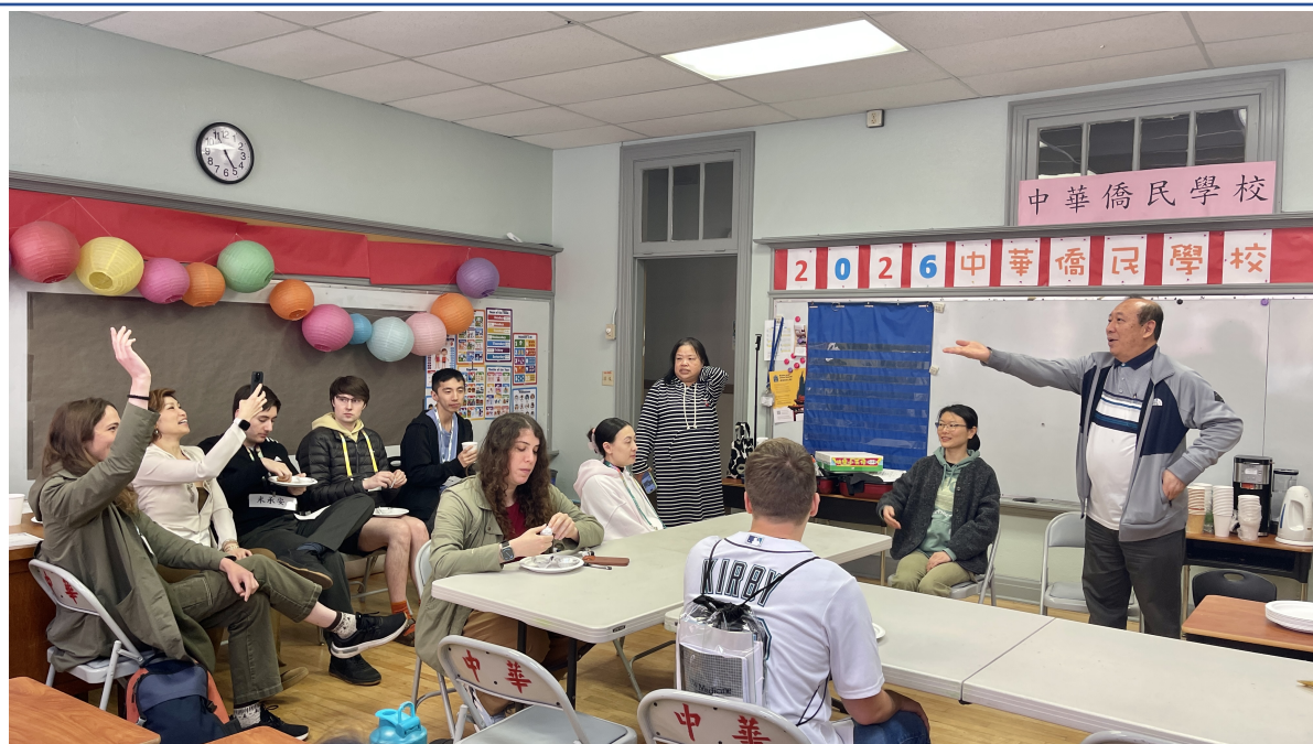
學生積極且踴躍的分享對臺灣華語文學習中心的建議