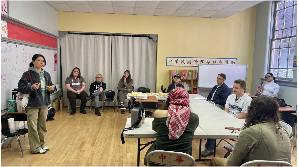
西雅圖僑教中心代表 答覆學生的問題