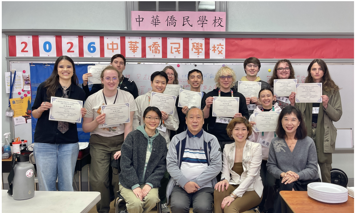
初級班 L1 結業典禮 頒發結業證書