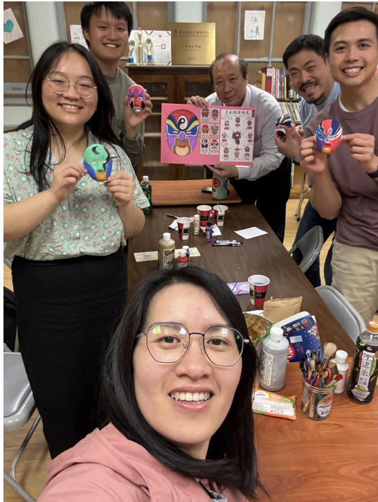
學生在結業典禮中的成果展 2