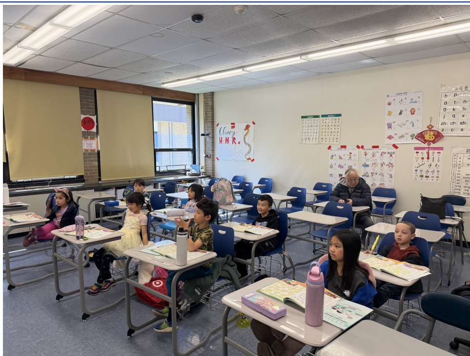
新海中文學校舉行華語歌曲教唱活動