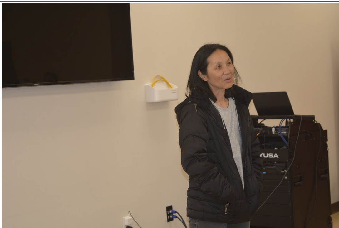
學生個人中文分享