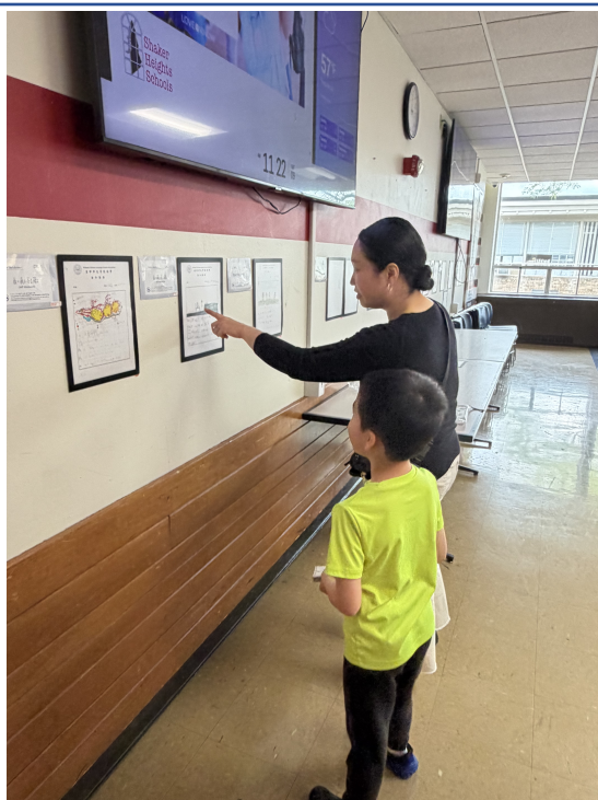
學生帶媽媽觀摩自己的作品