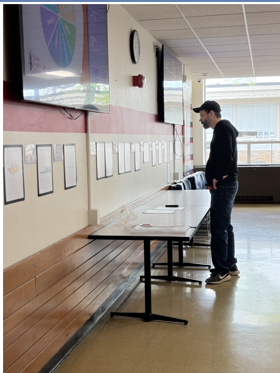
爸爸觀摩學生作品