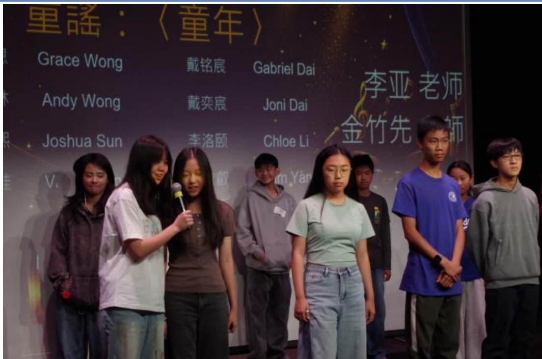
中學一班和學生志工表演童謠-童年