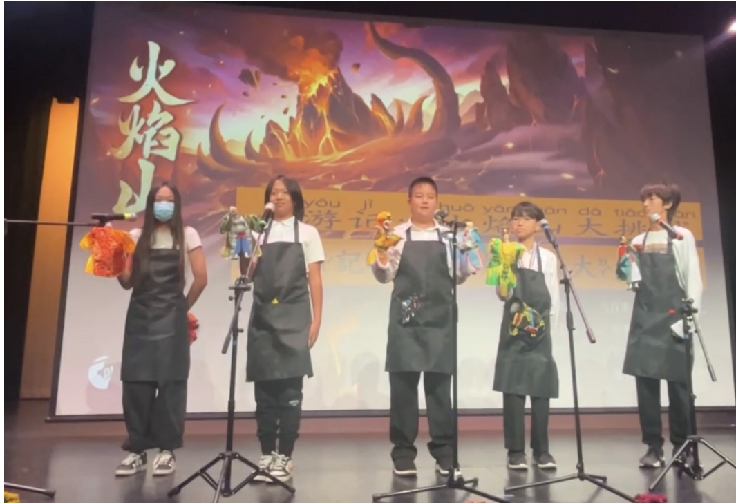
中文六班表演布袋戲-西遊記