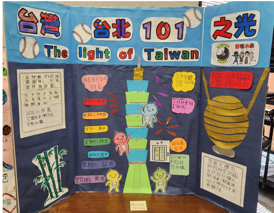
中年級組作品之一