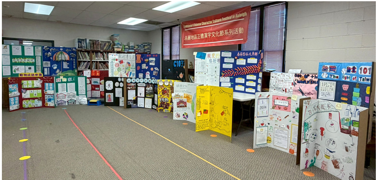
各班海報一字排開，各具特色