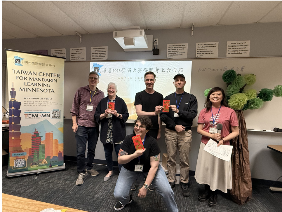
方主任和歌唱大賽團體組得獎學生合影

對TCML-MN的學生這不只是一次比賽，更是一段充滿音樂、語言與文化交流的珍貴回憶。