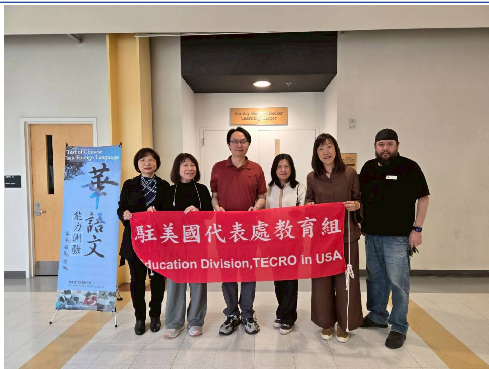
當天行政執行團隊留影