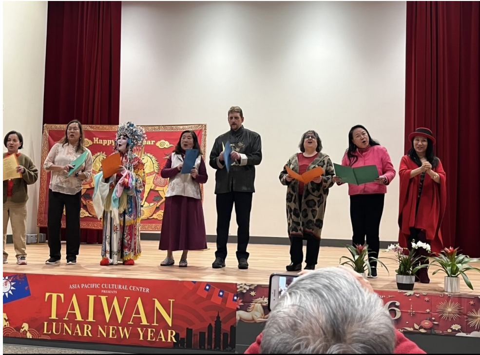
學生和老師在新春活動以國語演唱「恭喜恭喜」