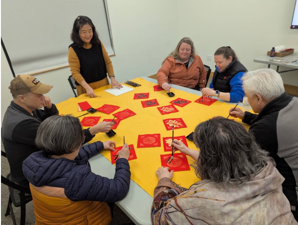
文化課書法親體驗