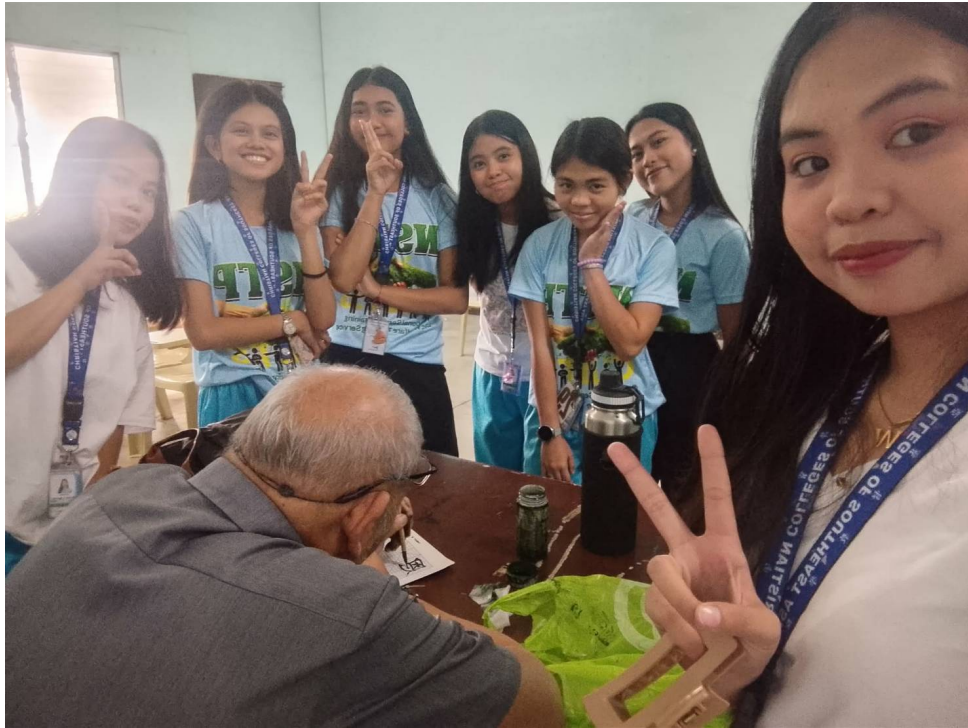
胡懷恩老師與學生