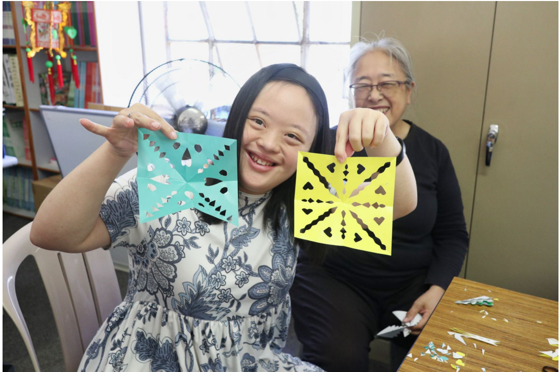
在歡笑中學習，在動手中成長。