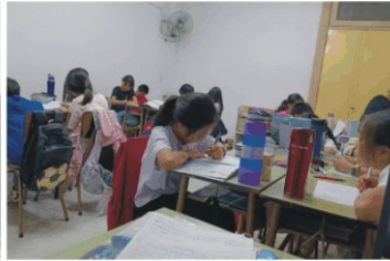
各班同學們的專心書寫圖