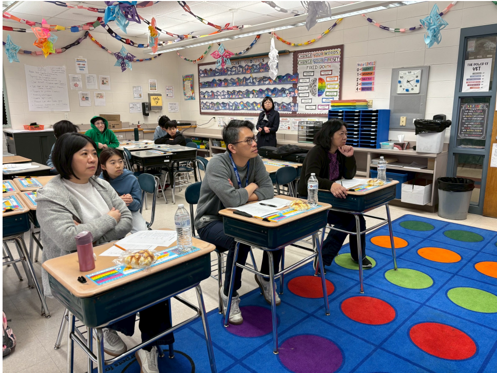
雙語班朗誦比賽由現任校長、歷任校長及前雙語班主任擔任評審