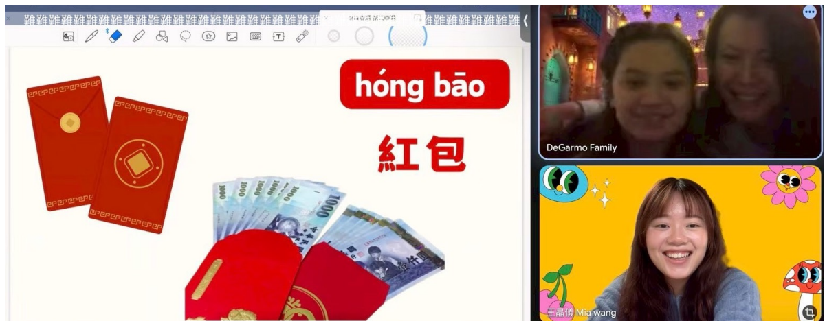
紅包具有文化符號，使活動更深入中華文化之意涵

本活動不僅展現海外僑校深耕華語教育之成果，更體現臺灣在推動正體中文及文化外交上的重要角色，為提升國際能見度與文化軟實力再添亮點。