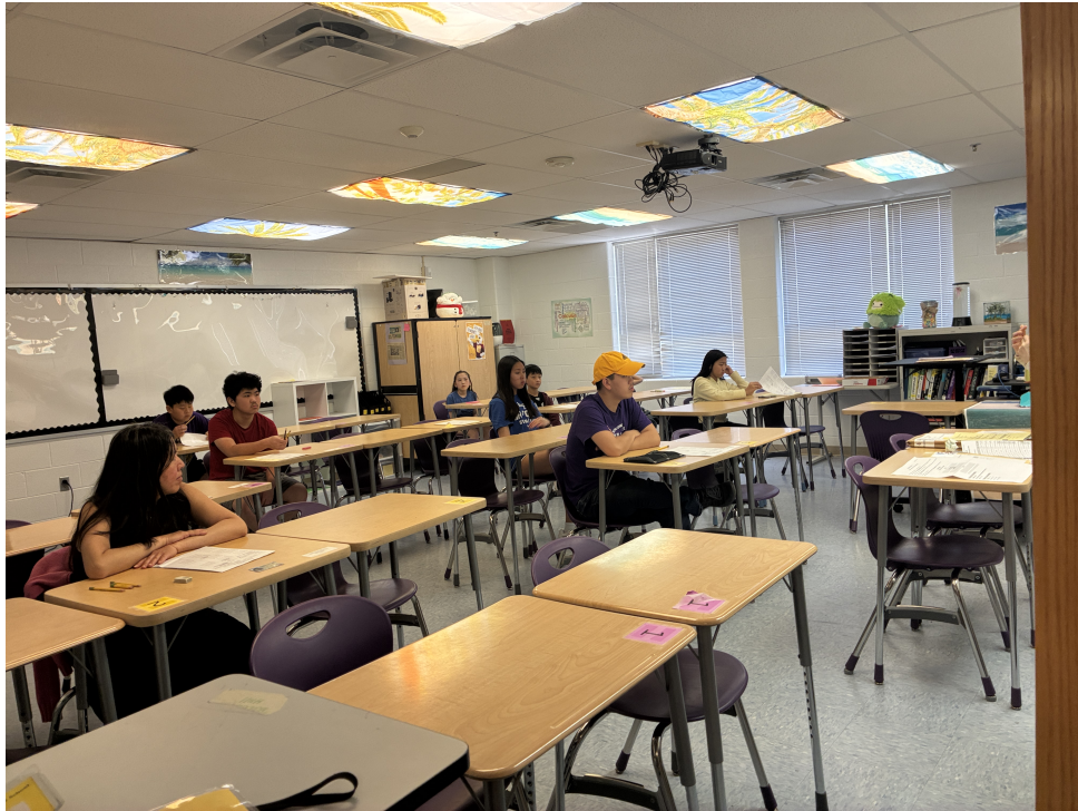
考生專心聽取考場要點說明，為測驗做好充分準備