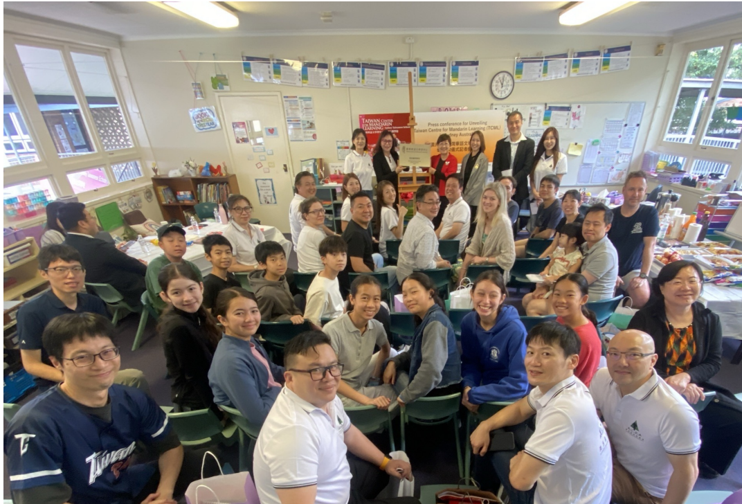
徐委員長親切的和揭牌儀式出席的記者和貴賓們共同合影留念。