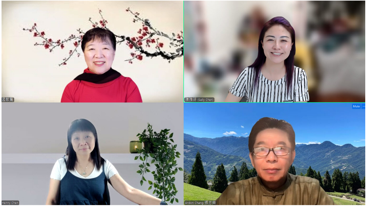
達福區中文學校聯誼會工作團隊