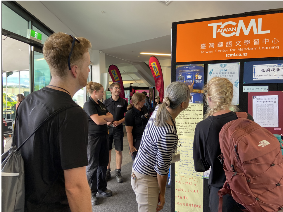
在場老師詳細講解