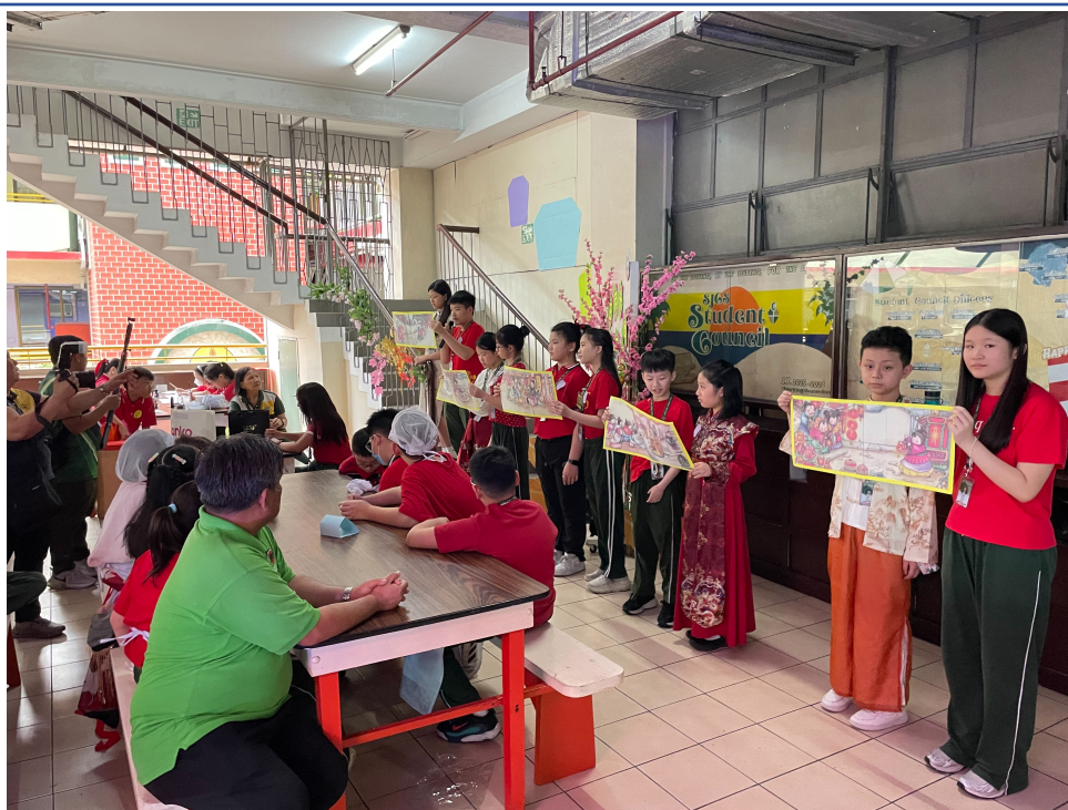
同學介紹元宵節由來