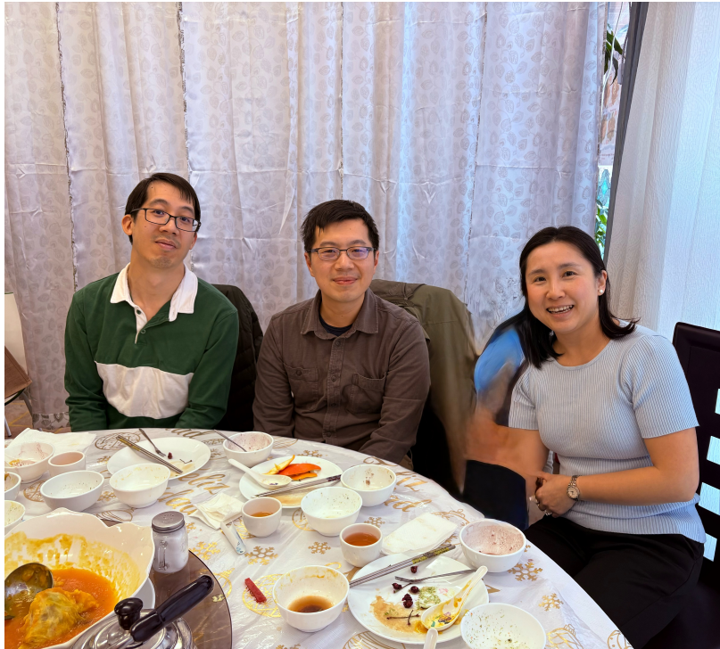
會長與貴賓親切敘舊，暢談近況，共敘深厚情誼