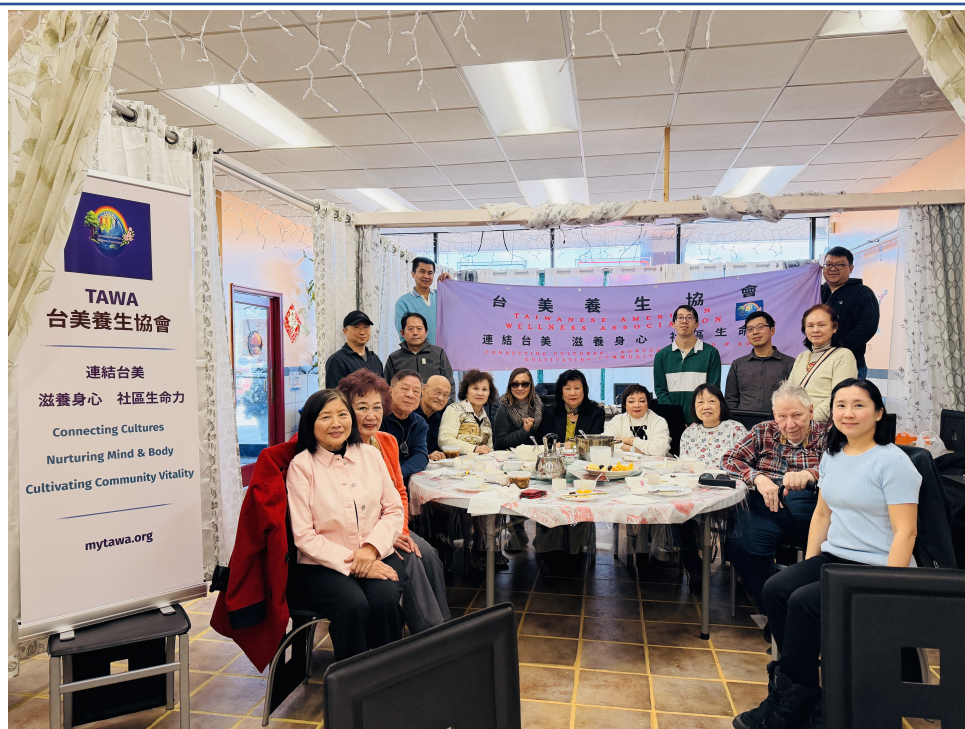
與會貴賓齊聚一堂，溫馨合影留念，場面溫馨而雅致