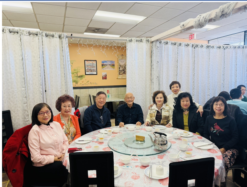
與會貴賓歡欣相聚，交流情誼，氣氛熱絡融洽