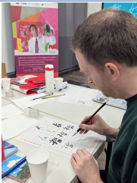
學員在水寫布上臨摹書法