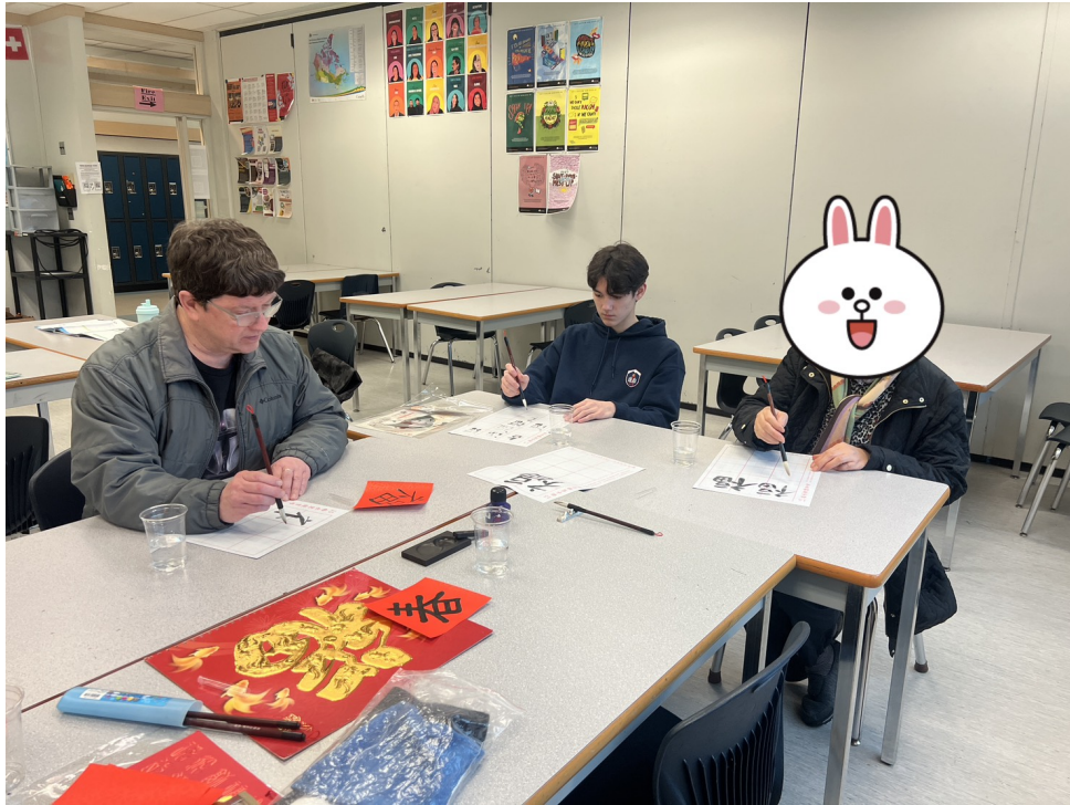
今天上課認識文房四寶，練習書法及新年用語