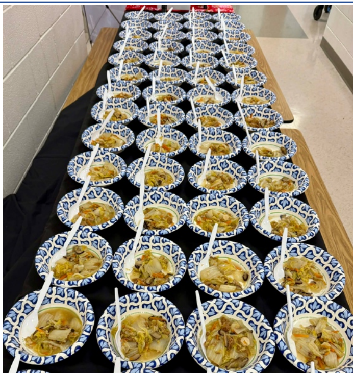
□菜滷供參與者品嚐、體驗臺灣味