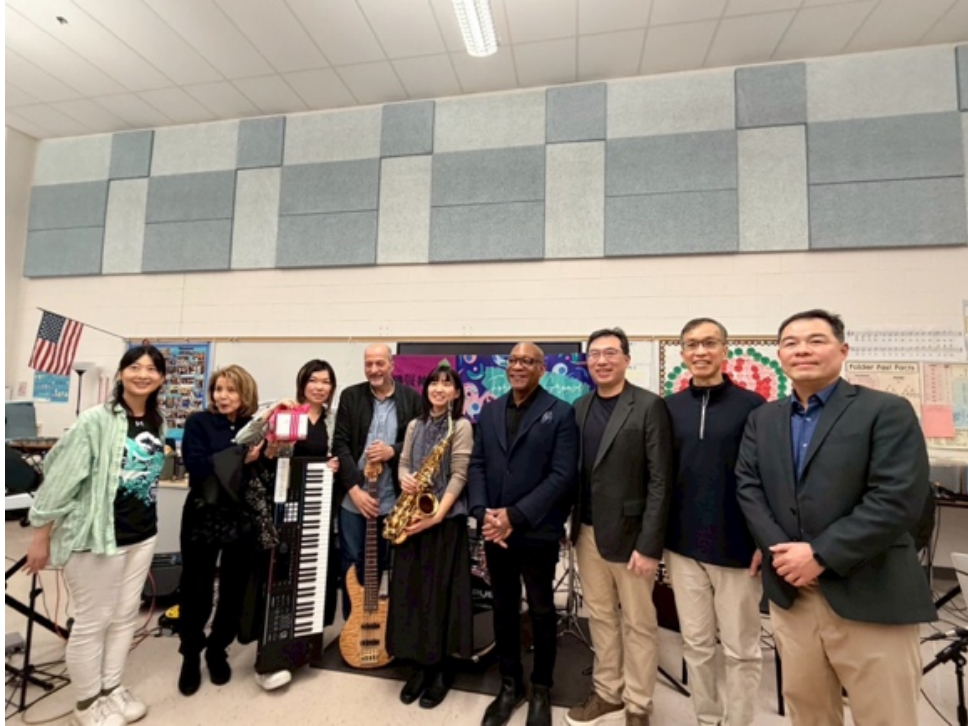
樂□們與僑教中□□主任合影