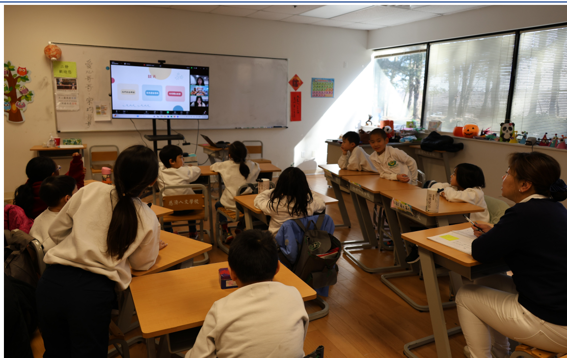
二靜的小朋友覺得線上課程很有趣、喜歡慈大老師們的課程