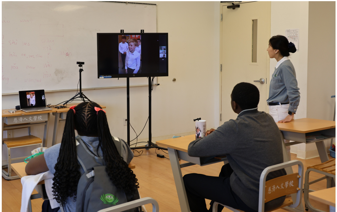
非華裔的CSL1B學生對於線上華語課程展現高度的興趣