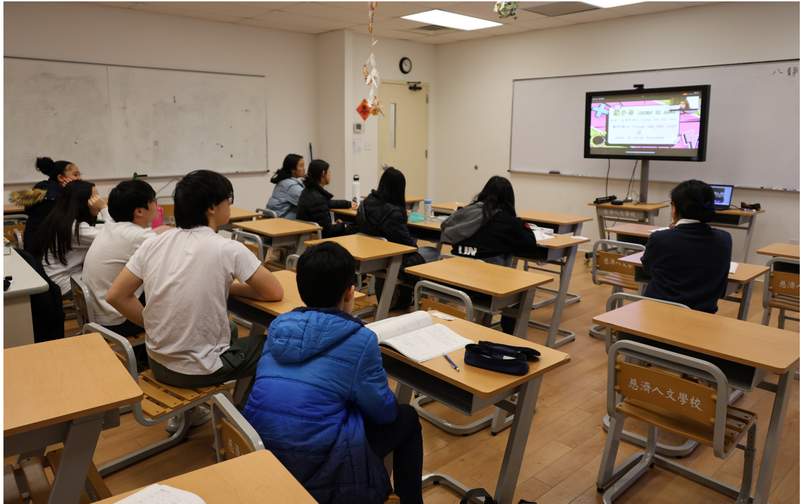
慈大老師與七靜學生介紹當代詩人以及詩詞之美