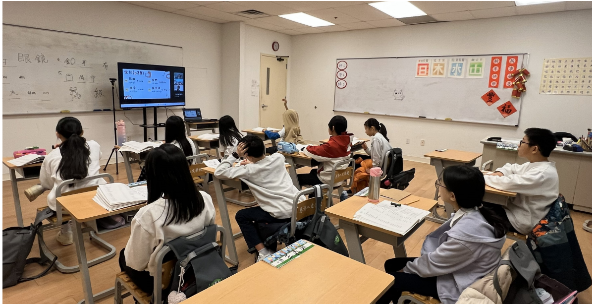
五六靜的學生喜歡和慈大老師互動