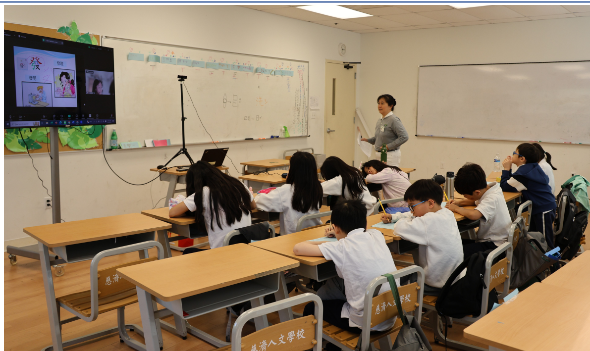
三靜孩子們正專注地進行慈大老師的小作業