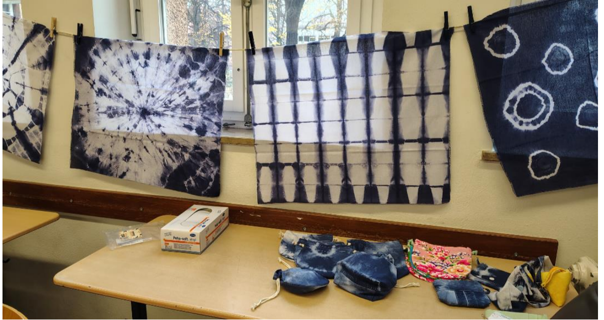
客家文化日「客家藍染手作」，一起體驗客家文化美學。