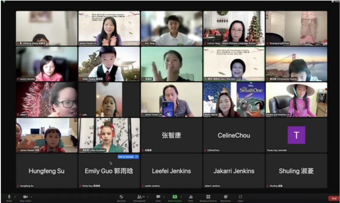
佛州中文學校聯合會 朗讀比賽大合照一