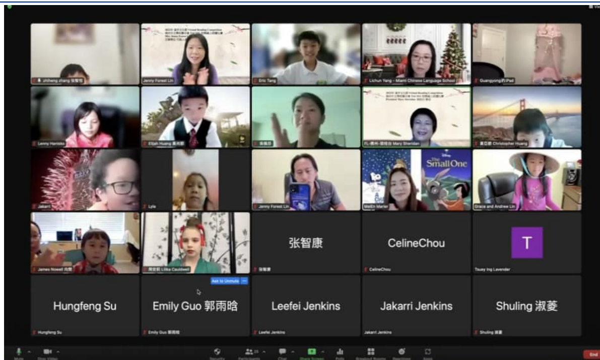
佛州中文學校聯合會 朗讀比賽大合照一