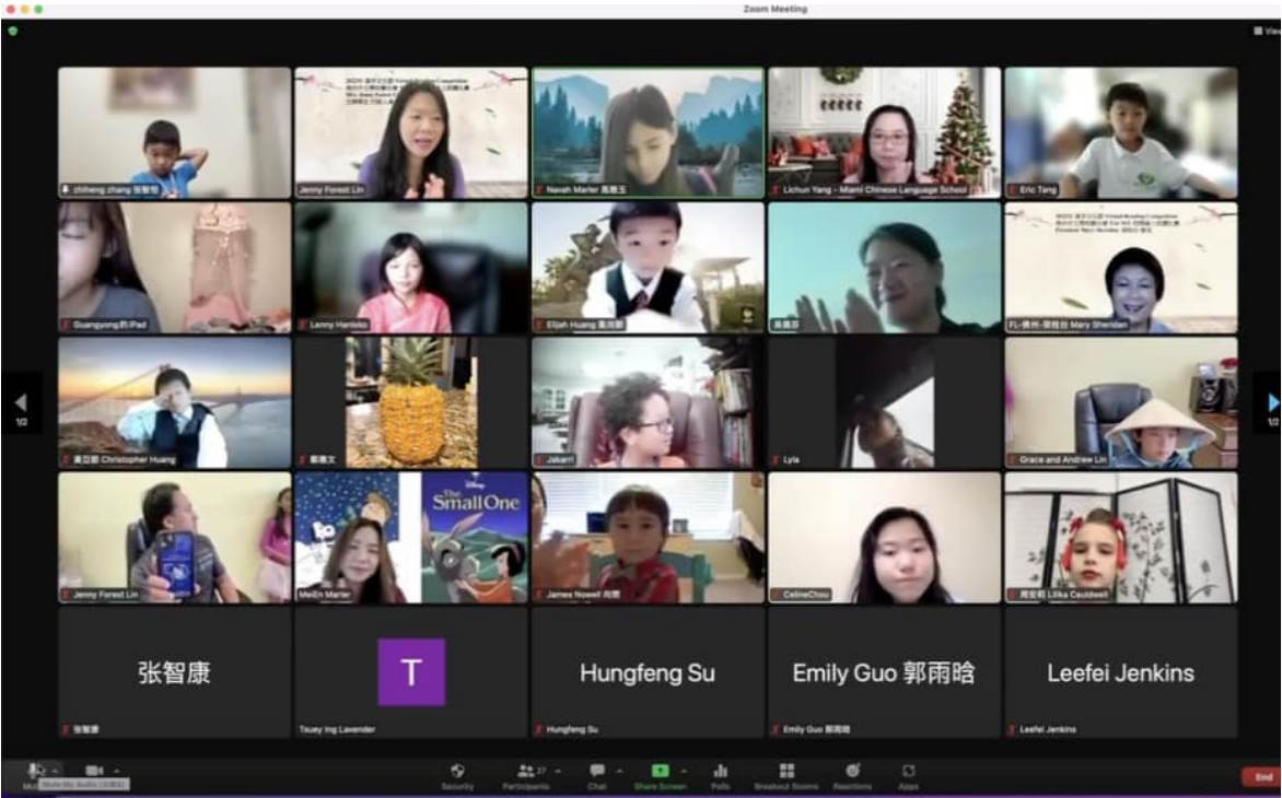
佛州中文學校聯合會 朗讀比賽大合照二