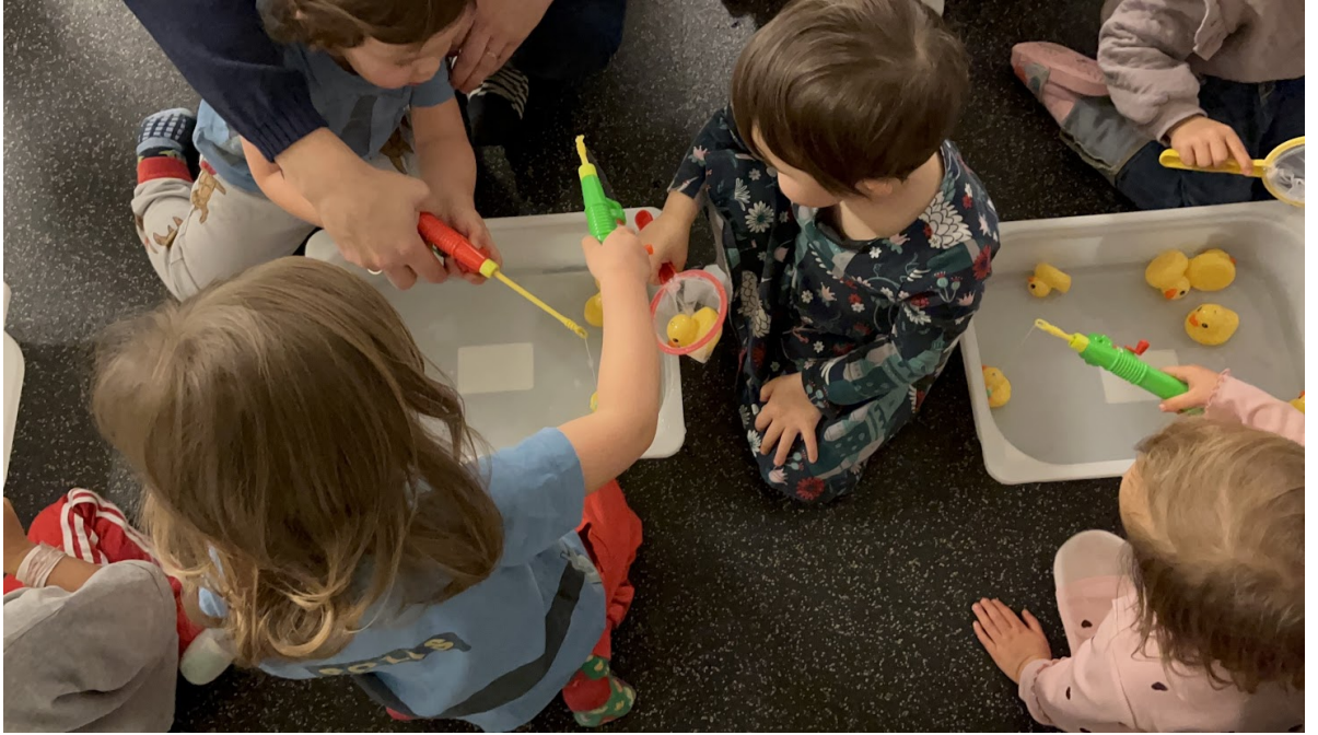
幼兒感官體驗活動