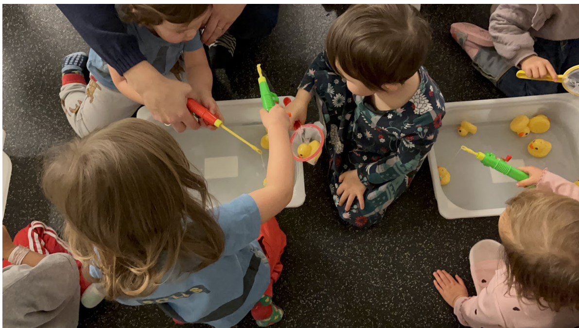
幼兒感官體驗活動