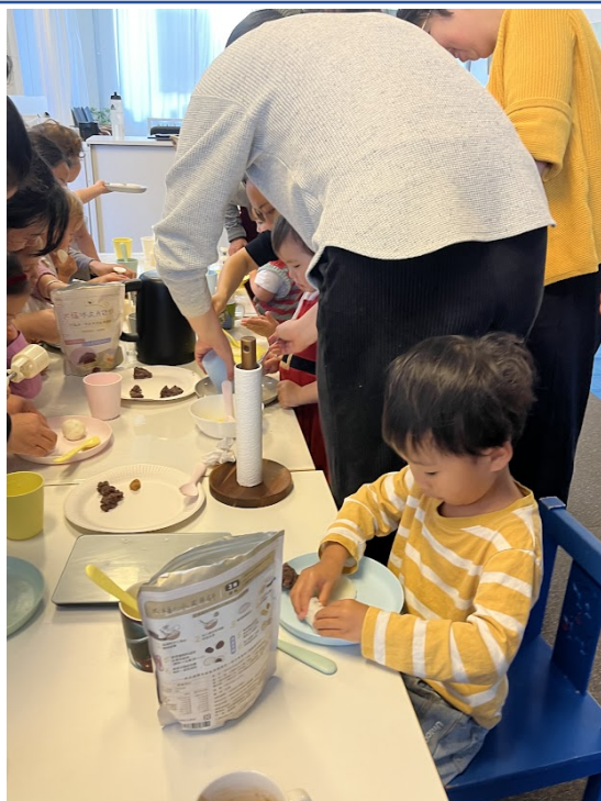
親子冰皮月餅DIY活動