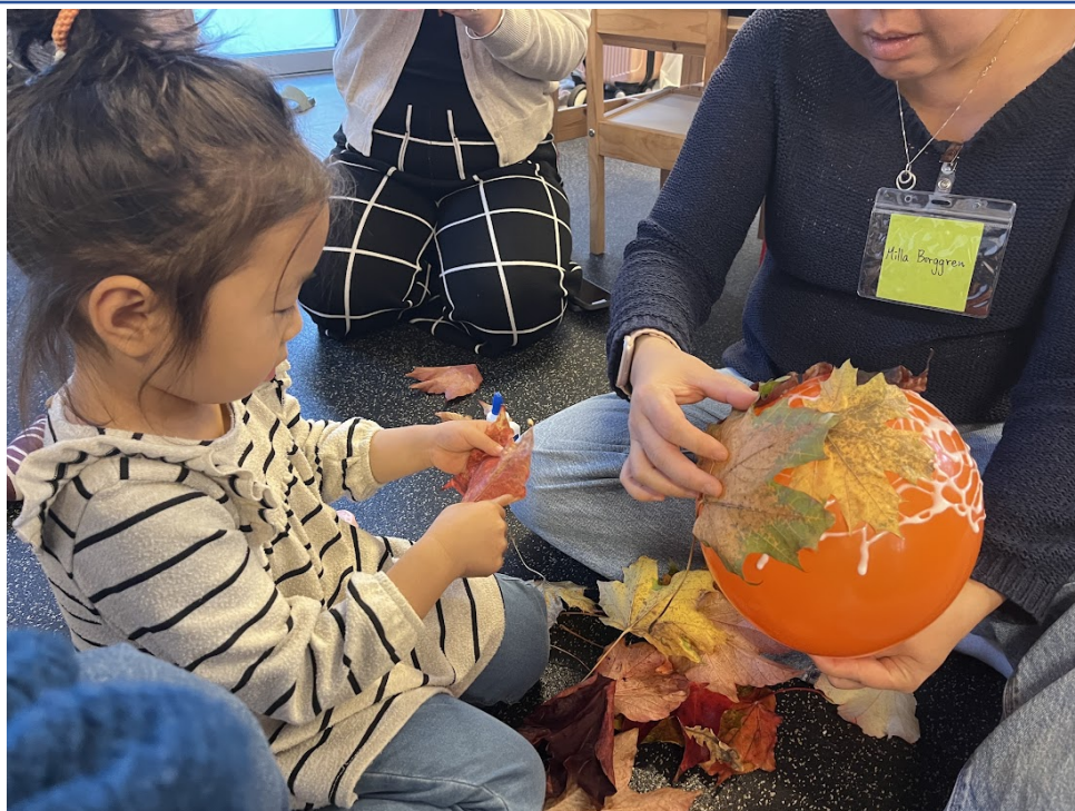
親子秋天主題學習活動