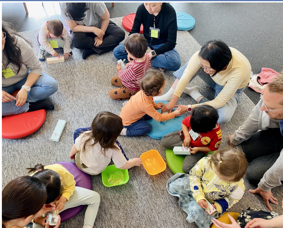
幼兒們製作自己的牙刷