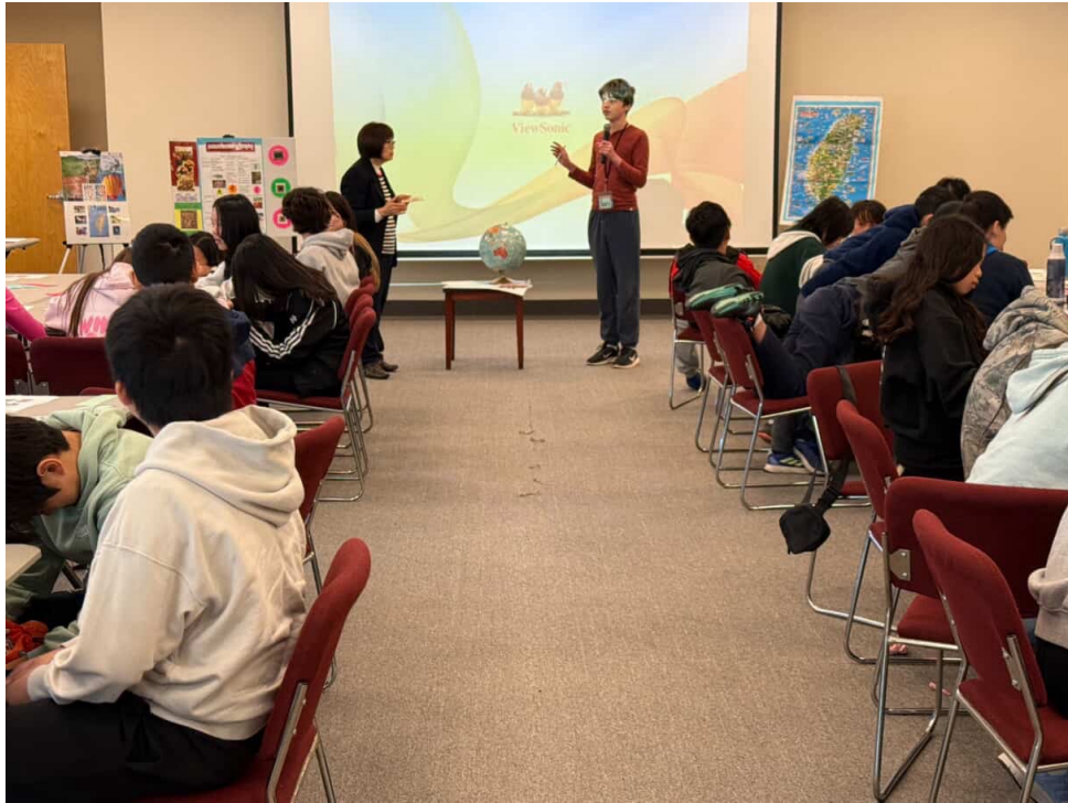
圖表6 學生分享心得