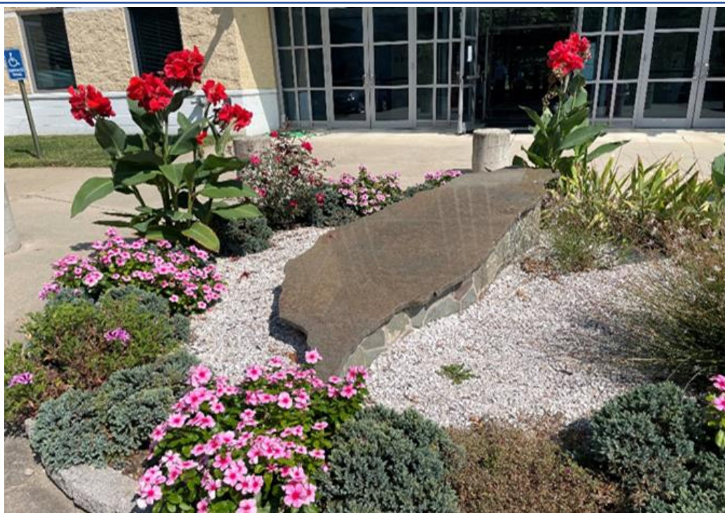
圖表5 TECRO臺灣地圖塑造的大理石地標