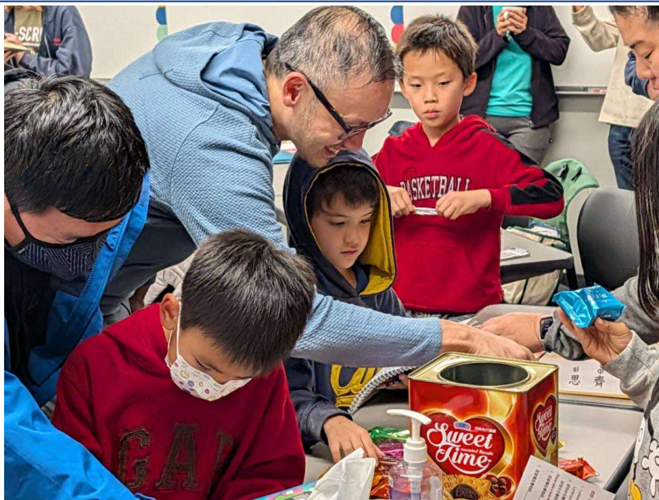
圖三：學習氛圍輕鬆、學伴間專注認真