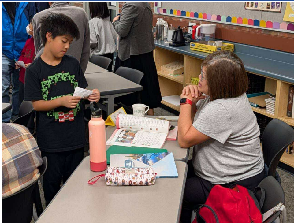
圖四：做中學—高成效的學習反饋