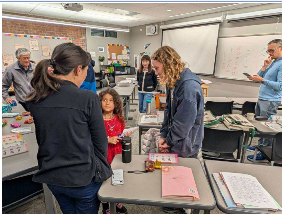
圖二：課堂生動活潑、趣味橫生