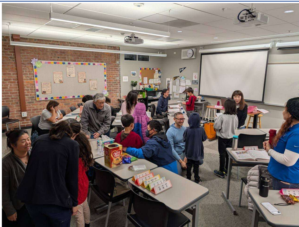
圖一：學齡兒童（CSL 2）與成人學員（TCML）