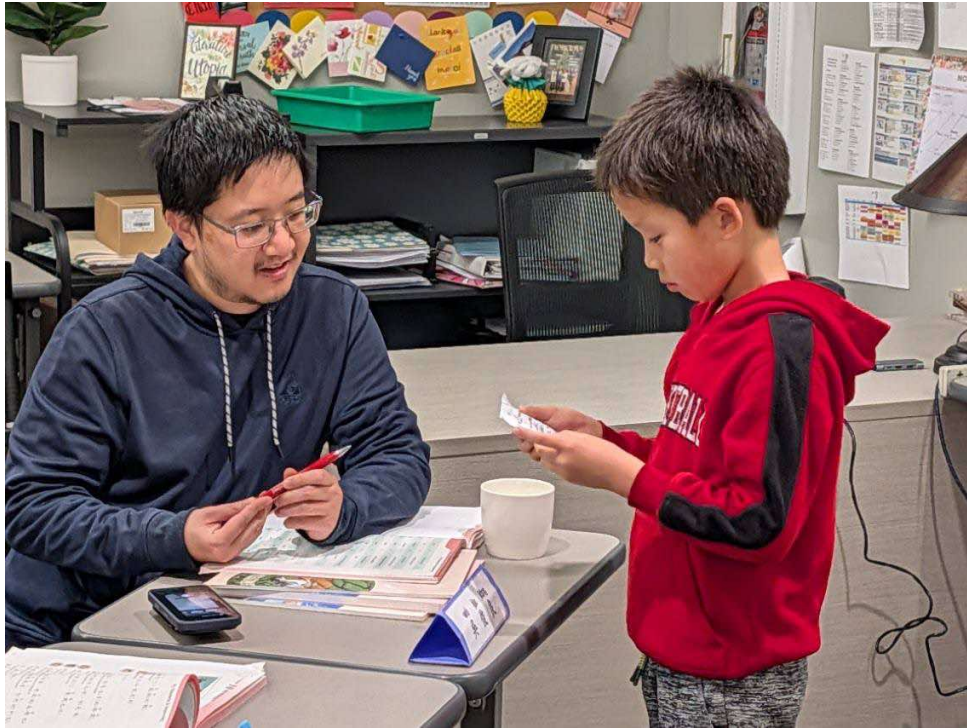
圖六：教室轉化為一個充滿生氣的社交場域